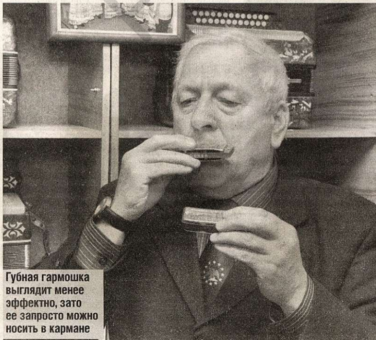
Губная гармошка выглядит менее эффектно, зато ее запросто можно носить в кармане

Алеся ГОЛОВЧИЦ, фото Дмитрия ЕЛИСЕЕВА, «ЗН»