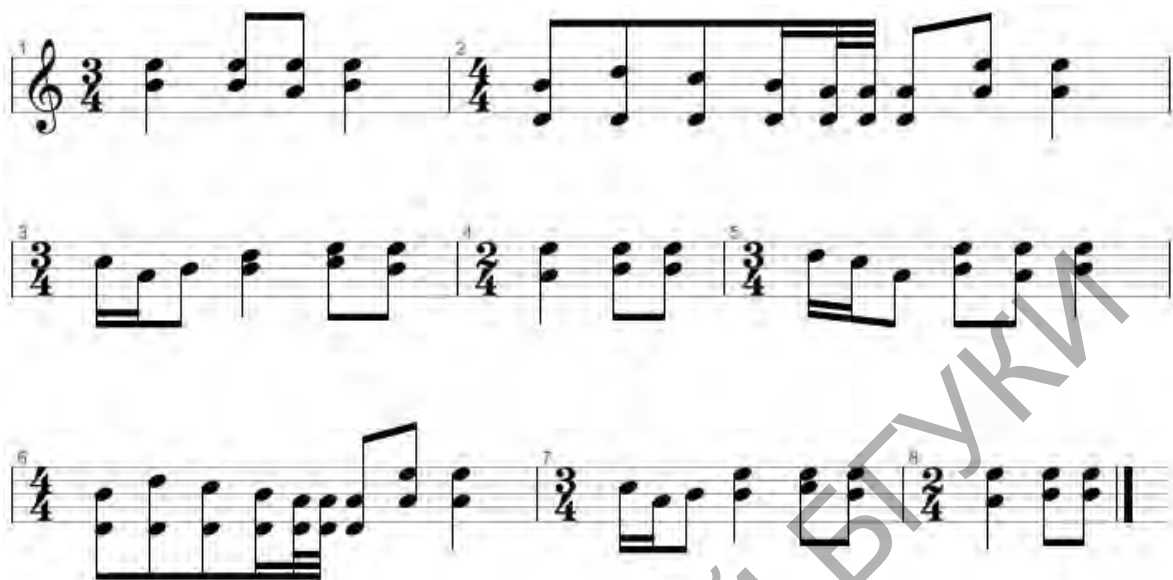
Малюнак 2. Найгрыш на скрытцы да песні «Слава таму...»

ва. Студэнтэ ж падрыхтавалі рэканструяваны найгрыш да песні «Слава таму, хто ў гэтым даму» (мал. 2), які выканалі разам з даласчанамі ў час прэзентацыйнага этапу праекта.