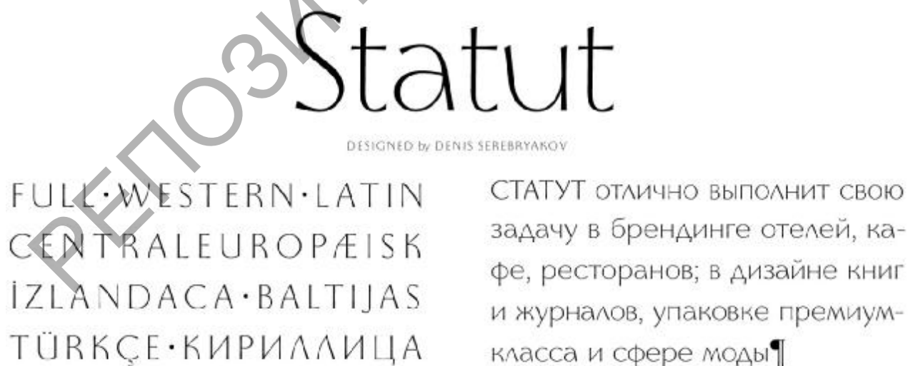
Рисунок 1 – Шрифт «Statut», автор – Серебряков Д.

Своеобразие национального дизайна проявляется в его языке – выразительных средствах графического дизайна, специфике методов формообразования, совокупности графических знаков и знаковых систем. Продукт дизайнерской деятельности представляется автором как результат органического сочетания в одном предмете структуры, т.е. внутренней формы вещи, обеспечивающей ее функциональную полезность; образа архетипа (как формы, обеспечивающей определенное восприятие вещи, ассоциативные связи ее образа с образами других вещей и образом человека данной культуры); культурного смысла (как формы и способа организации значений жизненного мира человека) [1]. В продуктах графического дизайна материализуются, определяются культурные архетипические установки, соответствие которым вызывает у воспринимающего субъекта подсознательные положительные чувства – гармонии, идентификации, надежности.