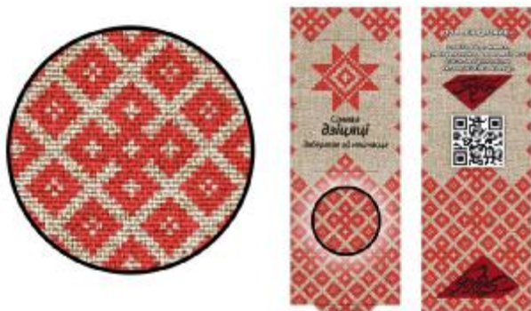
Рисунок 2 – Упаковка для брелоков, автор – Захаревич О.Д.

В результатах дипломной работы «Информационные технологии в изготовлении сувенирных изделий» автора статьи при создании оформления макетов упаковки для серии брелоков с символикой традиционной культуры Беларуси также использовалась техника ретроспективной стилизации. В качестве исходного материала для стилизации послужил элемент орнамента ручника, характерный для традиции народного ткачества Гомельской области [3, с. 31].