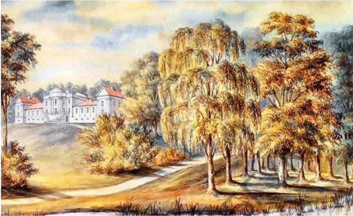
Палац Тышкевічаў у Лагойску. Акварэльны малюнак Напалеона Орды

Тышкевічы ўклалі вялікія сродкі ў развіццё марскога курорта Паланга, які належаў ім з 1824 г.: на пляжы ўладкавалі кабінкі для купання, пабудавалі прыстань з доўгім пірсам, гасцініцу, тэатр, прагімназію, у суседнім мястэчку адкрылі школу мараходства. Палангу набыў граф Міхал Тышкевіч (1761–1839), які ў 1812 г. сфарміраваў і ўзначаліў у Вільні 17-ы літоўскі ўланскі полк, названы «ўланамі графа Тышкевіча».