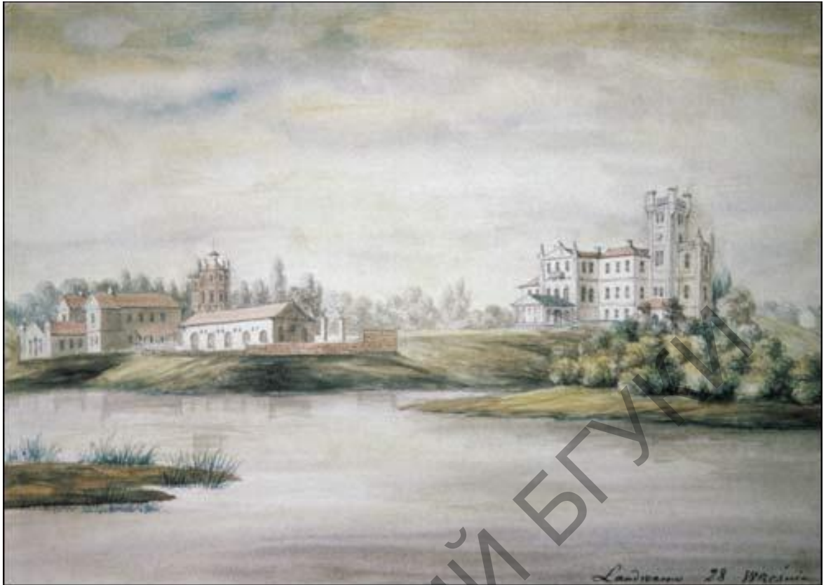
Палац Тышкевічаў у Лентварысе. Малюнак Напалеона Орды (1875–1877)

З пазіцый культуралогіі архітэктура – сістэма каштоўнасных арыентацый, сэнсавых уяўленняў, увасобленых у формах мастацтва. Палац – топас культурнай прасторы, сэнс якога не вычэрпваецца рамкамі мастацкай сферы, гэта музей, тэатр, бібліятэка, архіў. З палацам звязана калекцыяніраванне прадметаў мастацтва, музейных рэдкасцей, кніг, раслін, што азначае пачатак музейнай справы. Гэта прыкметная з’ява для ўладальніка палацава-паркавага ансамбля.