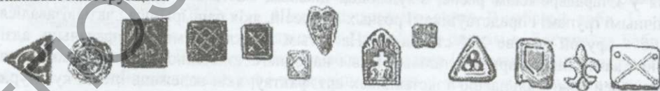
Малюнак 1 – Нашыўкі XII – XIII стст. Полацк, Ліда; курганны могільнік, в. Камена; Навагрудак; в. Рудня Полацкага р-на.

Не толькі ў часы Сярэднявечча была распаўсюджана аздоба адзення металам. Металічныя элементы ў аздабленні тканіны з'явіліся яшчэ да жалезнага веку, пазней гэтая сімволіка была ўдасканалена цывілізацыямі старажытных Егіпта, Грэцыі і Рыма. Металічныя накладныя і нашыўныя упрыгожванні паступова сталі адным з асноўных сімвалаў улады. Можна ўзгадаць пра круглыя, шчыльна аздобленыя металам каўняры фараона, жрацоў, імператара, караля, вышэйшых саноўнікаў і воінаў. Металічная аздоба адзення з выкарыстаннем золата, срэбра, бронзы, медзі і сплаваў была шырока распаўсюджана ў скіфскай культуры, культуры скандынаўскіх земляў. Найбольш працягла традыцыя пакланення металу існавала ў жыхароў паўночна-ўсходніх земляў сярэднявечнай Еўропы [8; с. 11]. Зразумела, што на беларускіх землях выкарыстанне металічнай аздобы было звязана з уласнымі магічнымі ўяўленнямі. Шлях ад сімволікі паганскай (праз пераасэнсаванне яе сімволікі і матываў хрысціянствам) прывёў да арыгінальных сімвалічных і знакавых канструкцый.