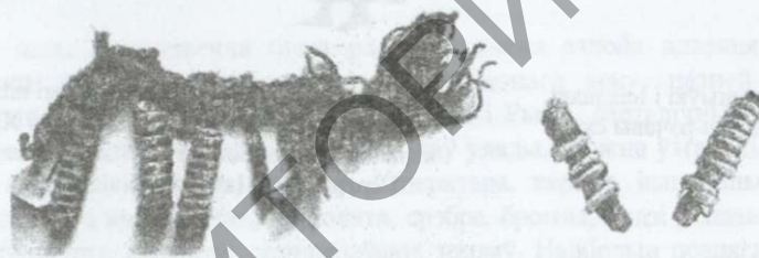
Малюнак 6 – Тасьма-пляцёнка з махрамі, ўпрыгожанымі спіральнымі бронзавымі пранізкамі. XI – XII стст. Полацк. Малюнак 7 – Драўляныя палачкі, абвітыя палоскаю ліставой бронзы, якімі аздаблялі тканіну. X – XIII стст. Курганы Віцебскай вобл.

Ланцужкі і драцяныя спіралькі (інакш спіральныя пранізкі) былі адметнасна толькі гарадскога і вясковага сярэднявечнага тэкстылю, бо ў княжацкіх пахаваннях на тэрыторыі Беларусі іх не знойдзена. Даволі верагодна, што спіралькі імітавалі вышыўку залотным і срэбраным матузом, акрамя гэтага, спіраль, выкананая з металу, мела падвойную сімвалічную абярагавую функцыю. Таму спіральных пранізак нашывалася нямаля, нашываліся яны пераважна на галаўных уборах і па берагах адзення, нярэдка гарызантальнымі і вертыкальнымі радамі [5, с. 54 – 55] (мал. 6). Да сімвалікі метала дадавалася сімваліка дрэва: колькасць метала імітавалі або спалучалі сімваліку абранага дрэва і метала. Гэта выконвалася пры дапамозе тонкай драўлянай палачкі, якая абвіталася палоскаю ліставой бронзы і прымацоўвалася да тканіны [5, с. 54 – 55] (мал. 7). Аналагічна вертыкальнай сярэднявечнай металічнай аздобе ў традыцыйным касцюме размешчаны кутасы па долу наплечных пакрываў, хустак і т.п., махры, фальбона, карункі па долу традыцыйных фартухоў.