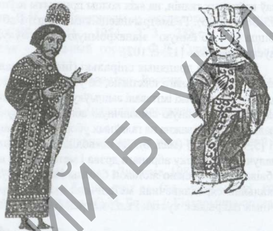
Малюнак 3 – Аздаба металічнымі нашыўкамі і буйнымі каштоўнымі камянямі строю караля Яраполка Тураўскага, каралеўскага жаночага строю. Паводле мініяцюры Кодэкса Гертруды (XII ст.), Радзівілаўскага летапісу (XV ст.)

Даволі верагодна, што металічныя нашыўкі, якія былі распаўсюджаны ў адзенні ўсіх класаў насельніцтва, па форме і сямантыцы маглі імітаваць залатыя і срэбраныя ўпрыгожанні святарскага і княжацкага строяў. Размяшчэнне маленькіх бронзавых ці пасярэбраных нашывак на розных кампанентах адзення ў выглядзе кола — ачэлле, каўнер-стойка, берагі рукава, падол — магло несці ахоўную сімвалічную функцыю, што пацвярджае сімволіка кола ў міфалогіі розных народаў свету, сімволіка кола і карагода ў фальклору беларусаў. Больш за ўсё металічнага дэкору змячалася ў багатых вясковых (найперш жаночых) строях X – XV стст. на ачэлли [2] (мал. 4).