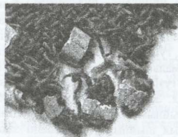
Малюнак 5 – Фрагмент ваўнянай тканіны саржавага пляцення з бронзавымі ўпрыгожаннямі. XI – XII стст. Полацк

Металам аздабляліся як тонкія, так і шчыльныя сурорыя тканіны. Напрыклад, адзенне з тоўстай тканіны, знойдзенае на Бабруйшчыне і датаванае XI – XII стст., было ўпрыгожана бронзавымі нашыўкамі, спіральнымі пранізкамі і ланцужкамі. Нашыўкі з высакародных металаў маглі дапаўняцца вышыўкай залатымі