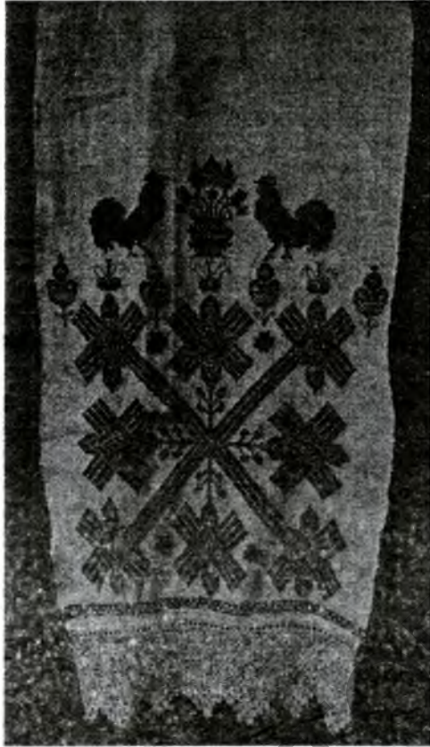
Малюнак 3 – Ручнік. 1950-я гг. Вышыўка лікавай гладдзю, крыжыкам. Знаходзіцца ў царкве в. Прусы Старадарожскага раёна Мінскай вобл.

Узор «на краста» ў ручніках Старадарожскага раёна не адносіцца да шырока распаўсюджаных. Гэтыя кампазіцыя і характэрныя арнаментальныя матывы вельмі адметныя. Яны не сустракаюцца ў беларускіх народных тканінах. Разам з тым, такі ўзор можна бачыць на стараверскіх ручніках Віцебшчыны, якія выкананы ў тэхніцы выбарнага ткацтва. Параўнанне зафіксаваных у Старадарожскім р-не ручнікоў «на краста» з музейнымі і апублікаванымі ўзорамі стараверскіх выбарных ручнікоў дазваляе нам меркаваць аб генетычным падабенстве іх арнаментальных матываў і кампазіцый. Яно відавочна нават пры тым, што ручнікі выкананы ў розных ткацкіх тэхніках і бытуюць на розных тэрыторыях.