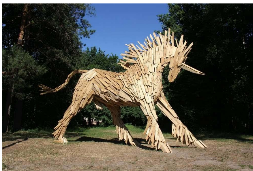
Рис. 2. Габор Сёке. «Единорог»

Герб вдохновил на создание 6-метровой фигуры единорога из деревянных пластин венгерского скульптора Габор Сёке в 2013 году (рис. 2). Долгое время символ бытовал исключительно в устных легендах жителей города. Именно опредмечивание данного образа в рамках арт-проекта привело к восстановлению исторического облика гербовой символики города [1]. (Решение Совета депутатов городского округа город Выкса от 28.02.2017 № 7 «О гербе городского округа город Выкса Нижегородской области»: «Флаг городского округа город Выкса Нижегородской области является официальным символом городского округа город Выкса Нижегородской области» 3 .)