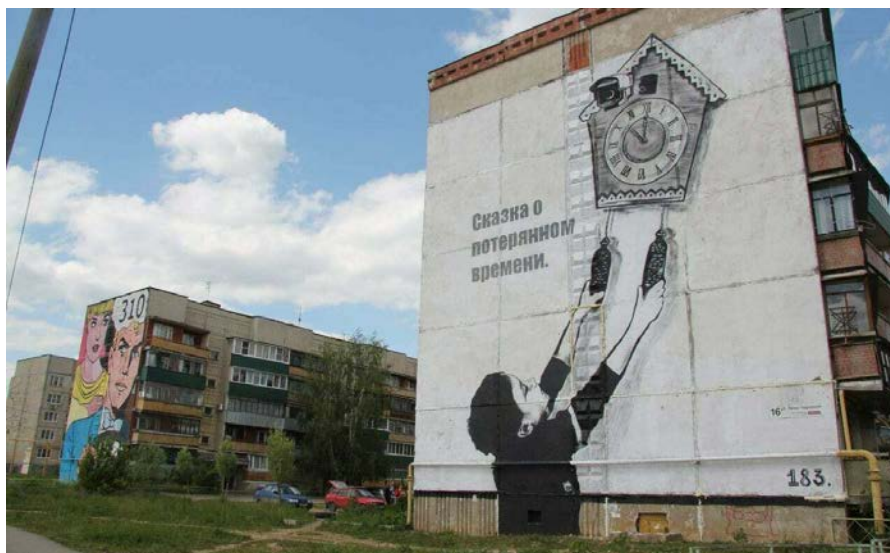
Рис. 3. Паша 183. «Сказка о потерянном времени»

«Building #...» Дмитрия Пархунова и Мартина Шольта представлял собой роспись в виде прямоугольников синего, красного, желтого цветов. Цель проекта – установление связи времен и буквальное отражение авангардного призыва «Искусство в жизнь!» в форме публич-арта (рис. 4).