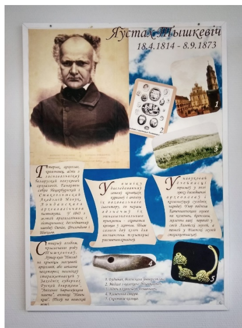
Рисунок 6. Стенд, посвященный Е. Тышкевичу.