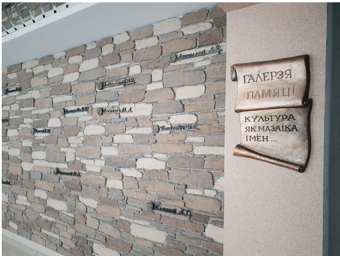
Рисунок 4. Галерея памяти «Культура як мазаіка імен».