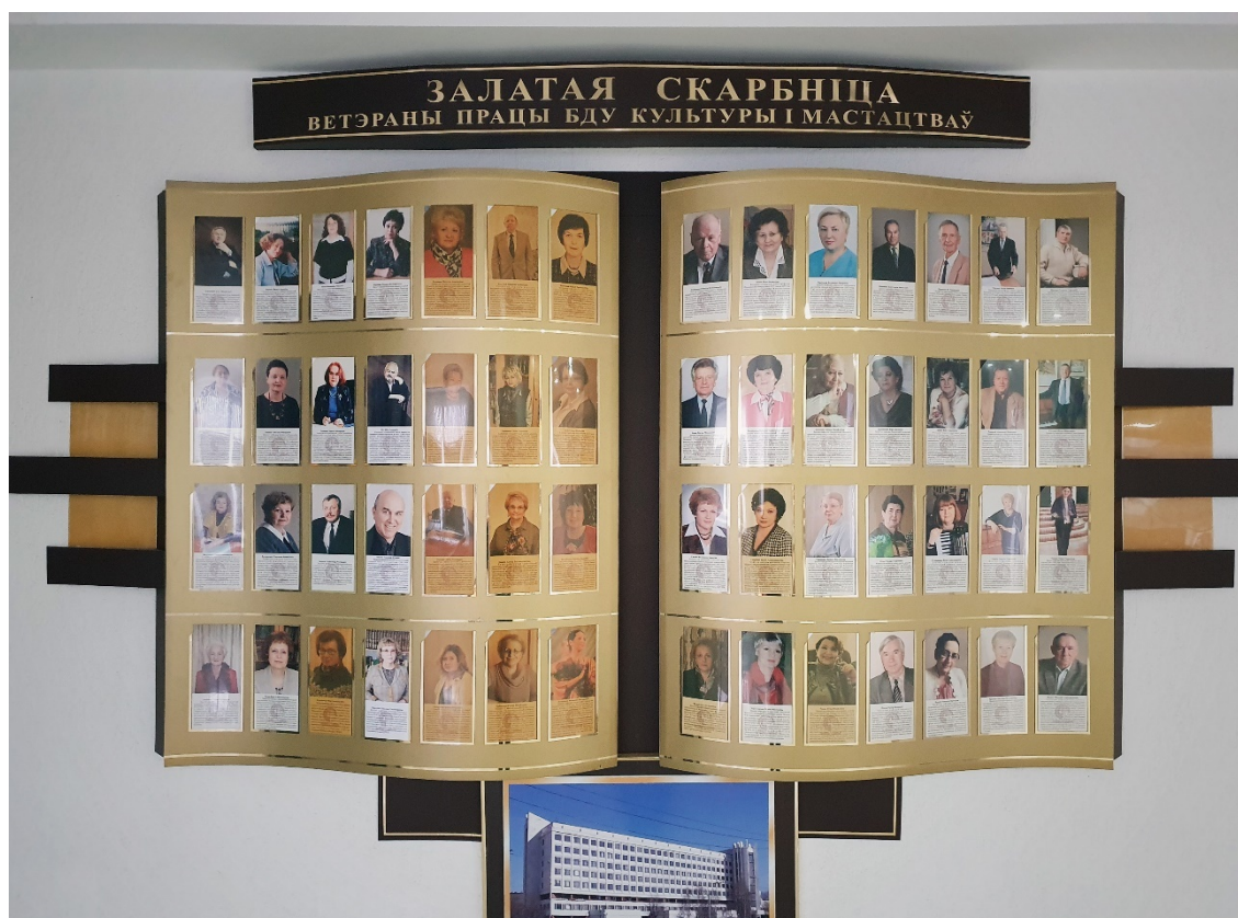
Рисунок 2. Галерея «Залатая скарбніца».

Коммеморативное пространство второго этажа симметрично и представлено двумя галереями. Первая из них, налево от лифтового холла, посвящена ветеранам университета – наиболее известным, заслуженным представителям профессорско-преподавательского состава. Галерея называется «Залатая скарбніца». Ее композиция представляет собой открытую золотую книгу – сокровищницу знаний [Рисунок 2].