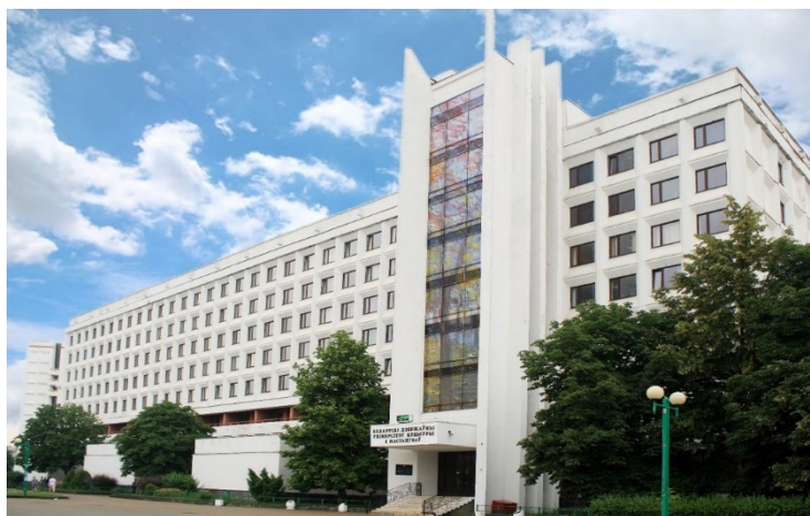
Рисунок 1. Белорусский государственный университет культуры и искусств

На первом этаже университета, в центральном холле, представлена его атрибутика. Это герб и знамя университета, расположенное рядом с государственным флагом Республики Беларусь. Два марша лестниц ведут на второй этаж, наиболее репрезентативный и служащий местом расположения руководства университета.