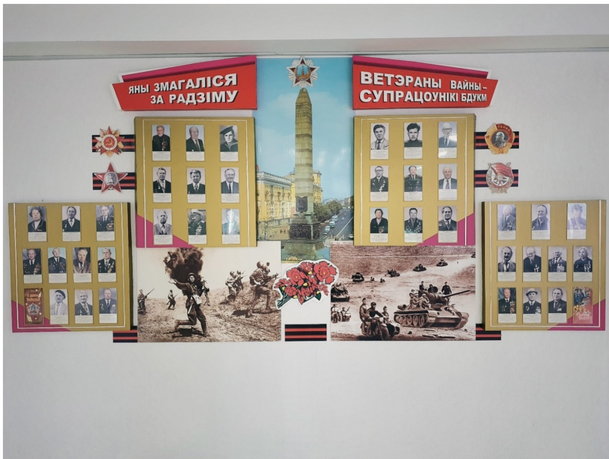
Рисунок 3. Галерея памяти «Яны змагаліся за Радзіму. Ветэраны вайны – супрацоўнікі БДУКМ».

Направо от лифтового холла расположена фотогалерея, посвященная сотрудникам университета – ветеранам Великой Отечественной войны. Композиционным центром и одновременно осью симметрии галереи является изображение монумента Победы в Минске, красных гвоздик и орденской ленты. Первый ярус галереи – ее название. Второй и третий ярусы составляют фотографии сотрудников университета, причем центром третьего яруса выступают изображения фронтовой кинохроники [Рисунок 3].