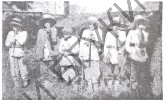
Малюнак 2 – Капэля пастухоўскіх труб беларуска-літоўскага памежжа (фота пач. XX ст.)

Пленэрныя танцавальныя імпрэзы - спантанна склаліся ў працэсе перанясення ў побыт гораду ведаў, уменияў і навыкаў, якія набылі гараджане пры наведванні гарадской моладзю народных свят, ці іх рэканструкцый, зробленых фалькларыстамі. Яны сталі крыніцай творчай самарэалізацыі маладых музыкаў (пераважна выканаўцаў на дудзе), якія не былі запатрабаваны афіцыйнай культурай. Такія імпрэзы ў добрае надвор'е ў 2008 - 2010 гадах штотыднёва адбываліся ў Мінску ля будынку Нацыянальнай бібліятэкі. Гралі пераважна чальцы мінскага «Дударскага клубу» (ля вытокаў яго ў 2007 годзе стаялі Тодар Кашкурэвіч, Зміцер Сасноўскі, Алесь Лось, Юрась Панкевіч, Дзяніс Сухі і інш. [5]). Акрамя беларускай дуды там гучаць нямецкія дудальзакі і галісійскія гайды, розныя віды ўдарных інструментаў. На імпрэзы збіралася пераважна моладзь з рэканструктарскіх («рыцарскіх») асяродкаў у колькасці ад 40 да 300 чалавек.