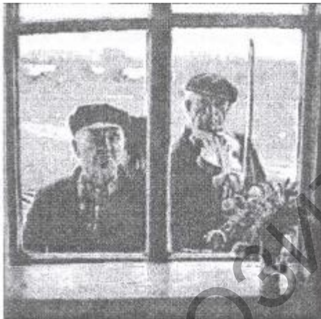
Малюнак 1 – Зачынальнік і скрыпак валачобнай падзвінскай дружны, 1970-я гг. (паводле З.Мажэйска)

Сёння, пасля 30-гадовага забыцця і наступнай 30-гадовай рэвіталізацыі дуды - каранёвага музычнага інструмента беларусаў - дударскі музычны рэпертуар з'яўляецца найбольш разнастайным і запатрабаваным у адпраўленні каляндарных свят (што, безумоўна, сведчыць, аб вялікім узросце дударскай традыцыі), падчас сямейна-побытавых свят, вячорак і бясед. У традыцыі выканаўцы на дудзе маглі выконваць твор як сольна, так і ў капэлі, куды звычайна ўваходзілі скрыпка і барабан ці бубен [1, 241]. Як адзначалі этнографы XIX ст., дудары - неад'емныя ўдзельнікі значных фальклорных падзей. Як зазначаў П.Шпілеўскі, «пры партыі валачобнікаў заўсёды маеца музыкант, а часам і два, адзін са скрыпкай, другі з так званай дудой» [3]. Некаторыя сучасныя даследчыкі лічаць, што ў гукарадзе дуды адсутнічаў мінорны лад, але нельга вылучыць агульны гукарад для арэалу існавання традыцыі ігры на дудзе. Археалагічныя знаходкі Л.У.Калядзінскага ў Віцебску сведчаць, што дуда бытвала на Беларусі ўжо ў XIII ст. [2, 150]. У сяр. XIX-пач.XX ст. інструмент выціскаецца з побыту з-за распаўсюджвання гармоніку. Традыцыя дударства амаль знікла ў 1950-1960-я гг. Але дзякуючы намаганням майстроў музычных інструментаў Ул.Пузыні, Ул.Грома, В.Кульпіна, А.Лася, Т.Кашкурэвіча дуду вярнулі «да жыцця». У XXI ст. з'яўляюцца новыя майстры і музыкі-дудары, якія спрыяюць адраджэнню дударскай традыцыі на Беларусі.