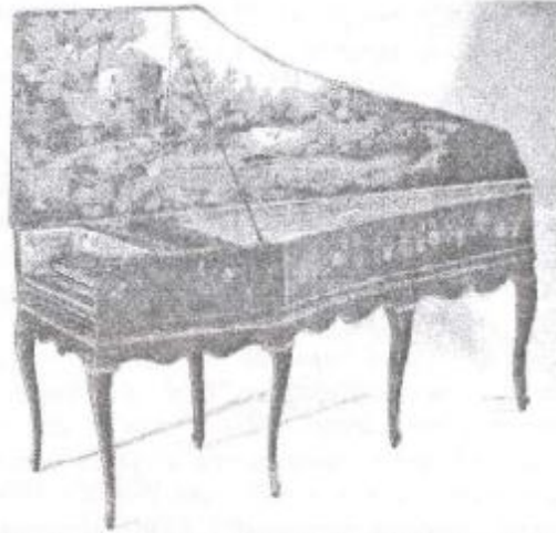
Рисунок 6 – Картина сельского пейзажа на крышке французского клавесина XVIII в.

Таким образом, сюжеты картин, которыми украшали художники старинные клавиры, были достаточно разнообразными - от иллюстрирования древнегреческих мифов до изображения бытовых («народных») картин. Но при всем многообразии мы можем отметить некоторую общность сюжетов, которые в разной степени связаны с музыкальной тематикой.