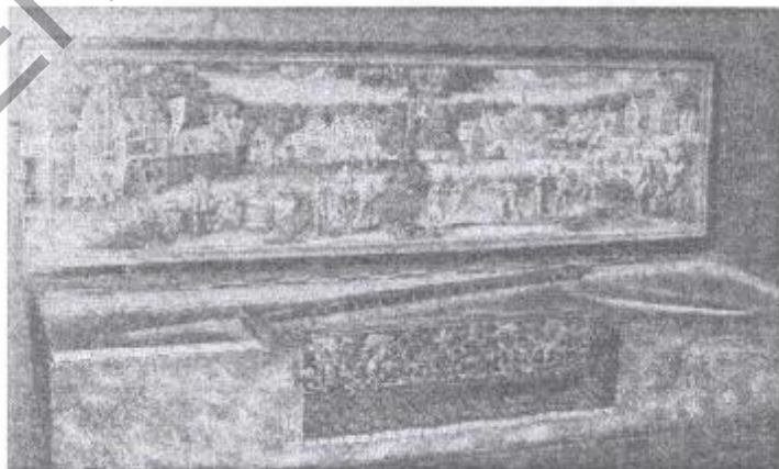
Рисунок 4 – Бытовая картина на крышке голландского вирджинала XVII в.

Однако, наиболее распространенными были сюжетные бытовые картины (или «народные» картины), которые изображали людей - представителей разных сословий, играющих на музыкальных инструментах. Во многих европейских странах с XVI века большую популярность приобретает домашнее музицирование, в это время игра в камерном ансамбле является одним из способов отдыха и развлечения.