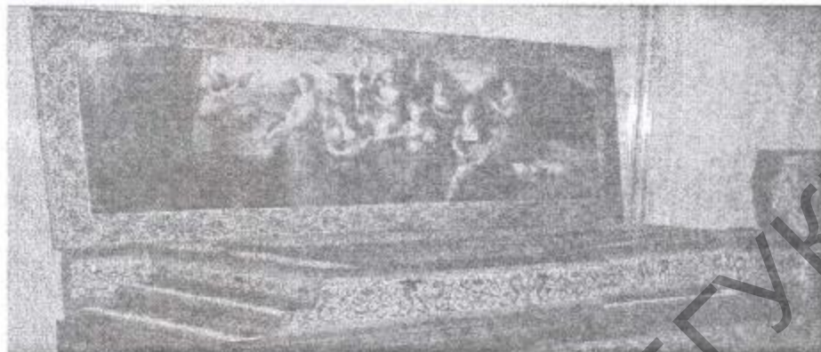
Рисунок 3 – Двойной вирджинал-спинет «мать и дитя», Й. Руккерс, Антверпен, 1619 г. Картина «Парнас», М. де Фос

Важным элементом украшения старинных клавиров являлась роспись крышки инструмента, в том числе изображение на ней сюжетных картин. Инструменты украшали крупнейшие художники XVII-XVIII вв. - П. Рубенс, Я. Брейгель, М. де Фос, А. Ватто др. Изображать музыкальные сцены в качестве украшений музыкальных инструментов, особенно клавесинов, предписывалось правилами того времени. Традициям использования различных сюжетов для художественного оформления музыкальных инструментов посвящает одну из книг своего трактата итальянский художник Джованни Паоло Ломаццо. Трактат Ломаццо много раз переводился на разные европейские языки и использовался как руководство вплоть до XIX века [1, с. 16-19].