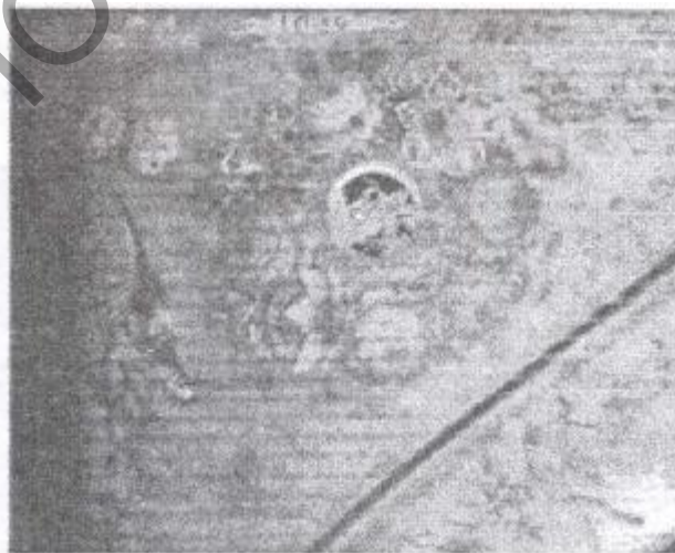
Рисунок 2 – Роспись резонирующей деки клавесина А. Рукерса, Антверпен 1636 г.

В декорировании инструментов в XVII-XVIII вв. - в период расцвета конструирования старинных клавиров - ведущие европейские мастера владели рядом специфических (региональных либо династических) приемов декорирования и техник. Высокого мастерства в художественном оформлении инструментов достигли фламандские мастера XVII-XVIII вв. Руккерс, Коучет. Инструменты Руккерсов изображены на картинах «Уроки музыки» Г. Метсю, «Кавалер и дама у вирджинала» Я. Вермеера [1, с. 16-19].