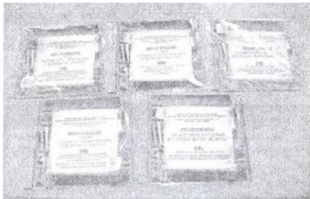
Малюнак 1 - Электронныя выданні (каталогі, падручнікі, 2007) НТЛ БНМІ БДУКМ

На базе музея НТЛ БНМІ праводзяцца лекцыйныя заняткі па курсам «Музычныя інструменты Беларусі», «Народна-інструментальнае мастацтва Беларусі», «Традыцыйныя мастацтвы» і інш. для студэнтаў БДУКМ. Супрацоўнікі музея праводзяць экскурсіі-знаёмствы з традыцыйнай інструментальнай культурай Беларусі для навучэнцаў, студэнтаў, гасцей і міжнародных дэлегацый універсітэта.