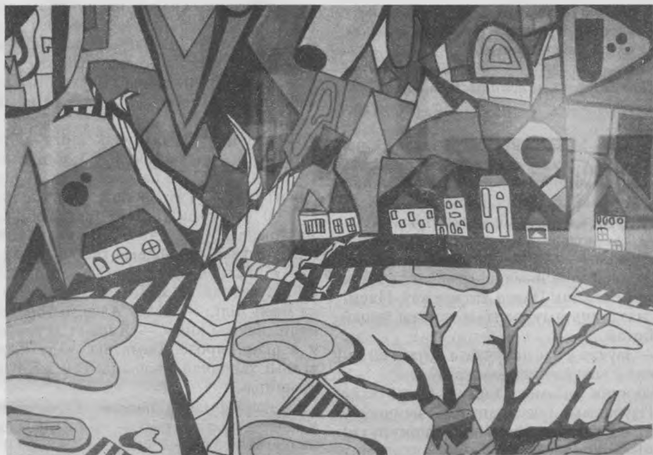
Паліна Ракоць «Зіmnі вечар».