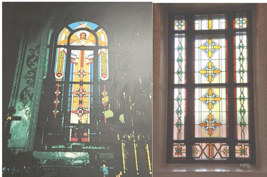
4. Витраж Михайловской церкви, 2000. Новокузнецк.