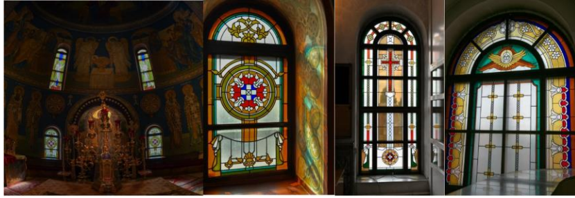
2. Витражи Знаменского кафедрального собора, 1995. Кемерово.