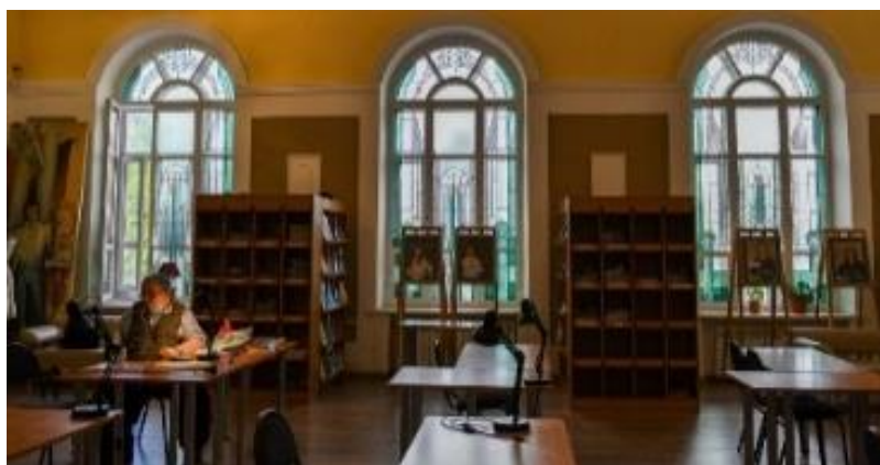
1. Витражи библиотеки Кузбасса им. В.Д.Федорова, 1994. Кемерово.