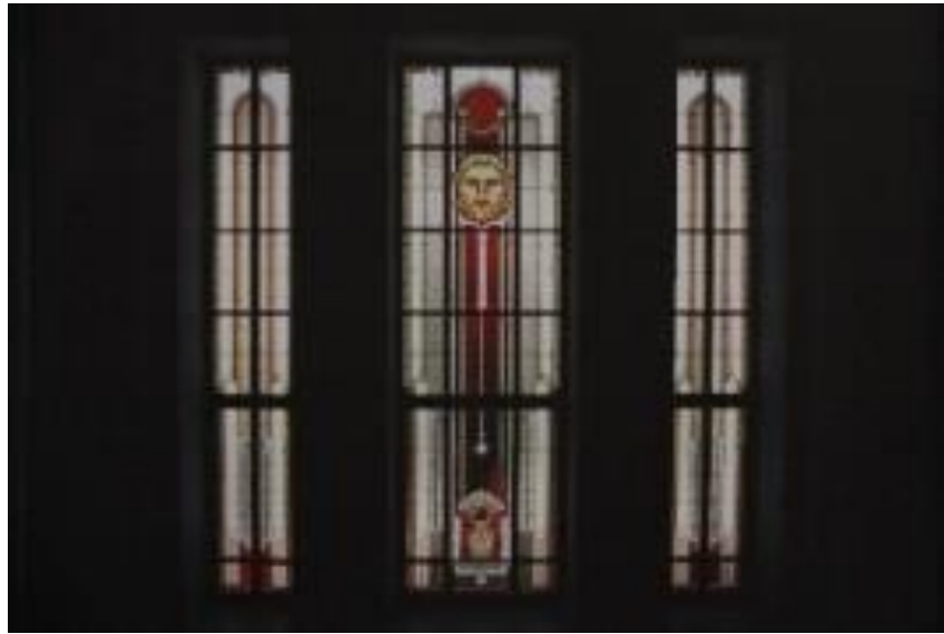
3. Витраж лестничного перехода театра «Красный факел», 2010, Новосибирск.