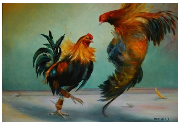
Рис. 3. Образец метафорической ассоциативной карты. Yvette Matysiak «Петухи»