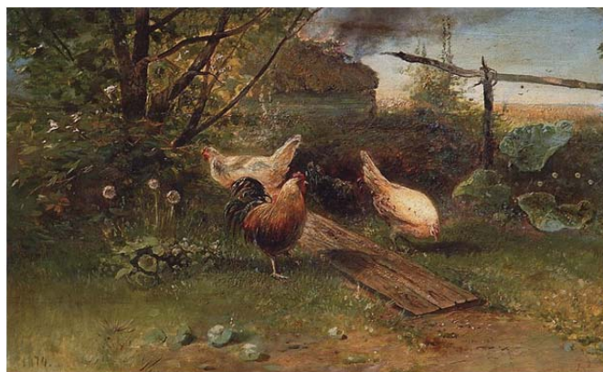
Рис. 6. Образец метафорической ассоциативной карты. А. К. Саврасов «Летний день»