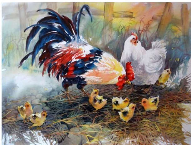
Рис. 5. Образец метафорической ассоциативной карты. Чжэнь Лин-Куан «Счастливая семейка»