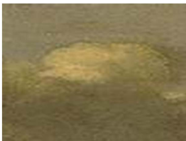
Рис. 7. Образец метафорической ассоциативной карты. Ф. Снейдерс «Бой петуха с индюком»