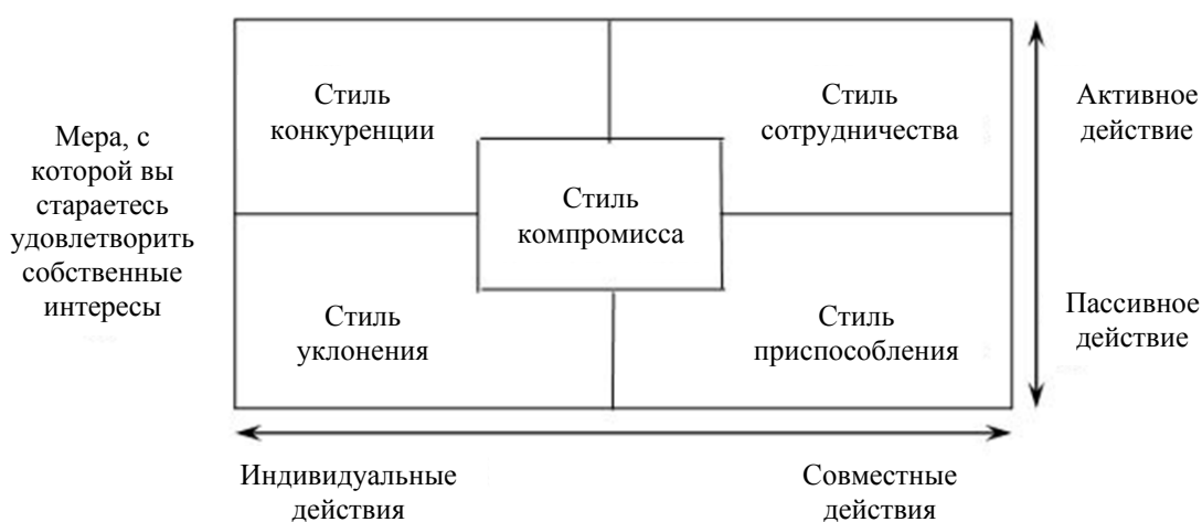
Рис. 1. Схема К. Томаса – Р. Килменна

Элемент 1. Настольное игровое поле. Представляет собой раздаточный материал (Рис. 1) [1; 6], изображенный на листе бумаги (формат А1).