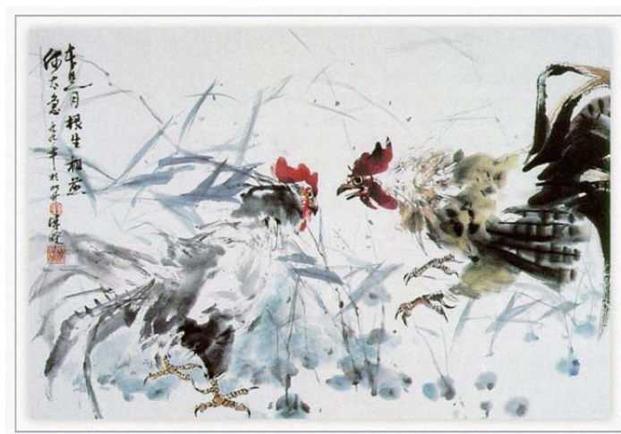
Рис. 4. Образец метафорической ассоциативной карты. Чжэнь Лин-Куан «Два боевых петуха»