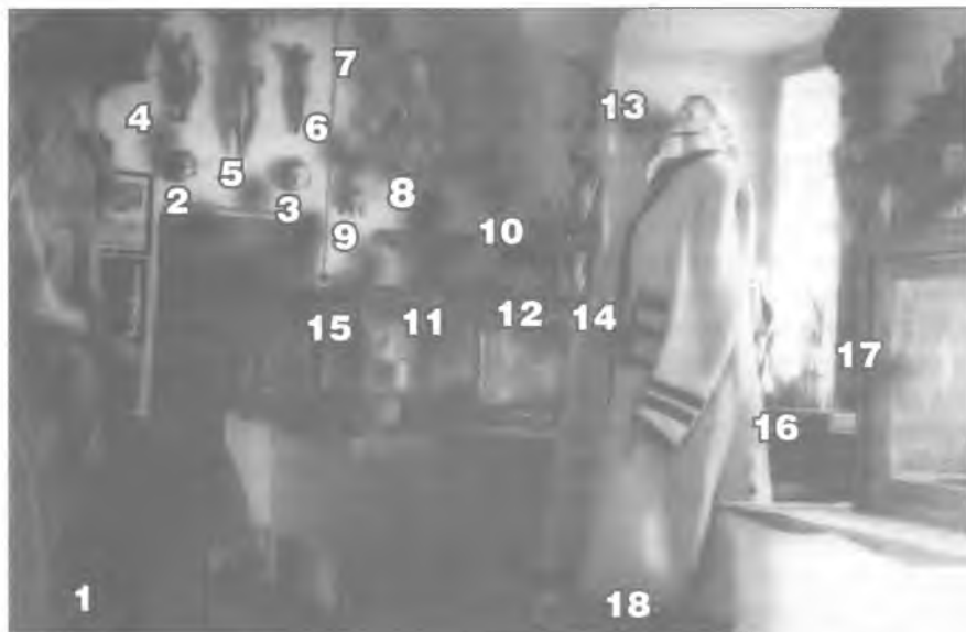
Фотаздымак 2. Частка экспазіцыйнай залы Беларускага музея імя Івана Луцкевіча ў Вільні. Канец 1930-х гг. Нацыянальны музей Літвы (EMiK 10).

2. "Драўляная разьба — бюст негра ў усходнім завоі — праўдападобна адзін з трох каралёў, пакланяўшыхся Хрысту. З Дзісеншчыны" (Інв. кн. № 52/259). Бюст валхва Валтасара. XVIII—XIX стст. Дрэва, разьба, паліхромія. НММ РБ, КП-1950. Выстава 2021 г.