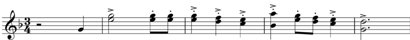
Пример 8 – Валторны in F