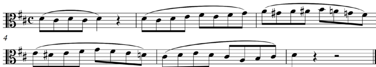
Пример 5 – Альт