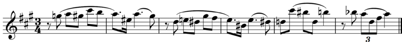
Пример 6 – Кларнет in B