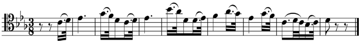
Пример 3 – Виолончель