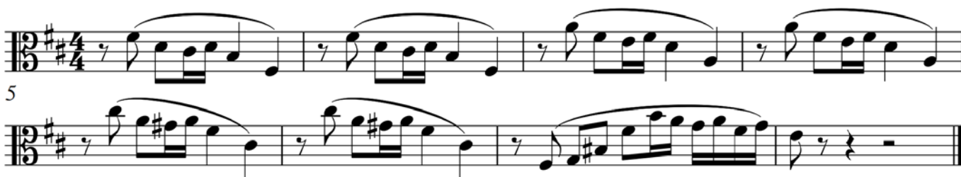
Пример 7 – Альт