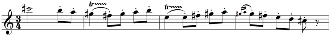
Пример 9 – Кларнет пикколо