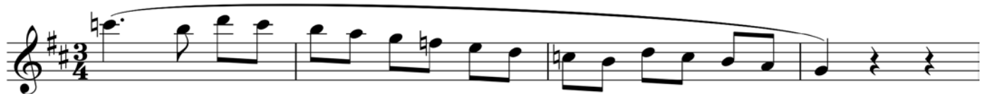
Пример 11 – Английский рожок