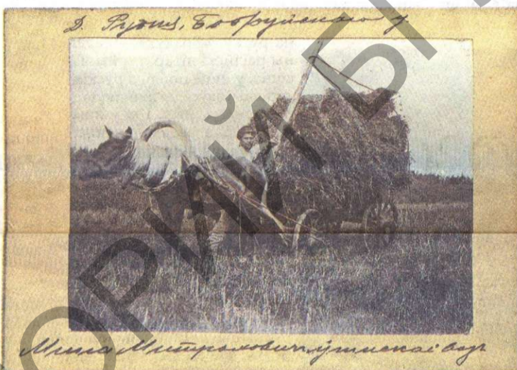
Міна Мітраховіч кладзе воз. Вёска Рудня Бабруйскага павета. 1912 г.

справаздачы, пратаколы пасяджэнняў таварыства, па якіх можна было высветліць патрэбныя факты. Апынулася, што захаваліся здымкі толькі з паездак 1911 і 1912 гадоў, адсутнічаюць фота з экспедыцыі 1913 года, якая была накіравана на вывучэнне заходніх раёнаў сучаснай Брэстчыны. І вельмі шкада, бо калі б гэтыя фота ацалелі, мы мелі б амаль усю тэрыторыю Беларусі, прадстаўленую на старых здымках.