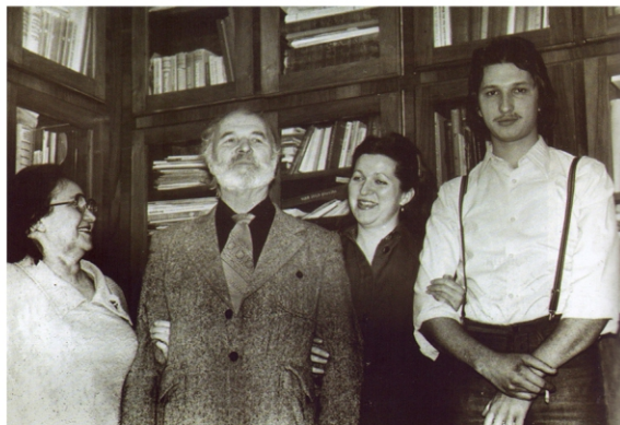
У хатняй бібліятэцы. 1979