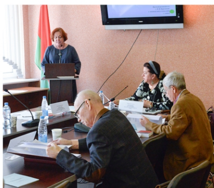
У час работы савета па абароне дысертацый