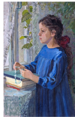
П. Масленікаў. Партрэт дачкі. 1951