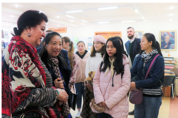
Прыём у БДУКМ дэлегацыі выкладчыкаў і студэнтаў Юлінскага ўніверсітэта (Кітай)