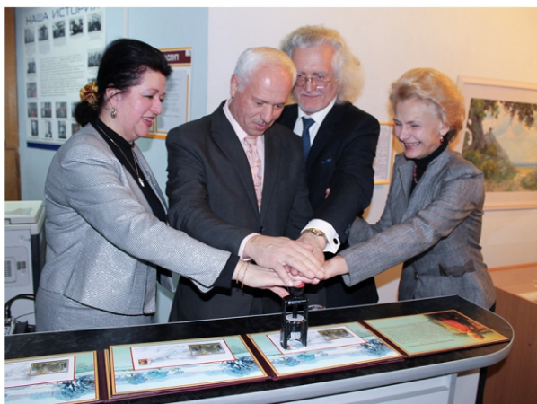
Урачыстае гашэнне канверта з маркай