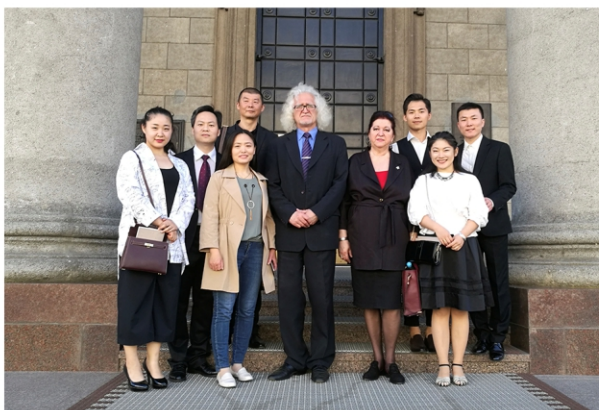
У.І. і В.П. Пракапцовы з гасцямі з Юлінскага ўніверсітэта (Кітай)