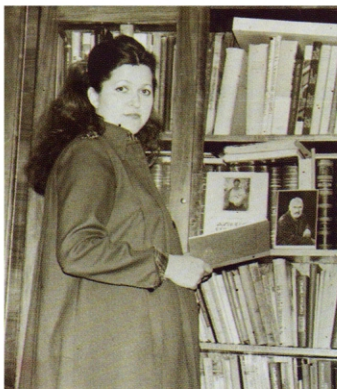
У бацькоўскім кабінэце