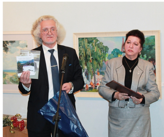
Прэзентацыя канверта з маркай і кніг В.П. Пракапцовай пра П.В. Масленікава