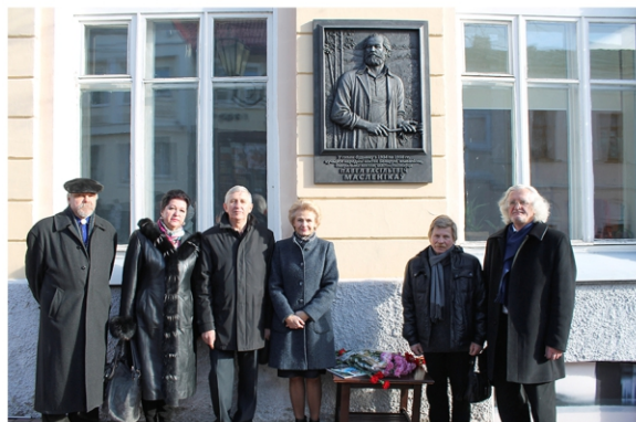
На адкрыцці мемарыяльнай дошкі П.В. Масленікава ў Віцебску. 2014