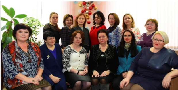
Калектыўнае фота выкладчыкаў кафедры беларускай і сусветнай мастацкай культуры. 2017