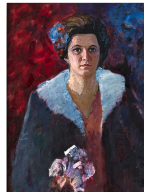
П. Масленікаў. Партрэт студэнткі Белдзяржкансерваторыі. 1972