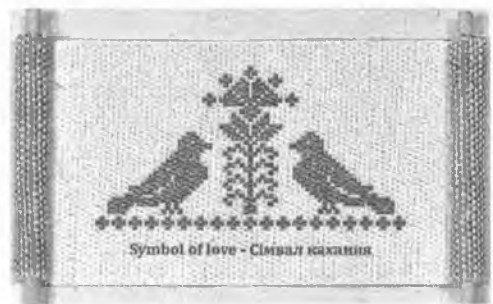
Рис. 2. Образ любви