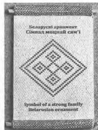
Рис. 3. Образ семьи