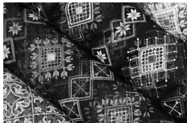
Рисунок 1, 2, 3, 4 – Ткань с машинной вышивкой мелким крестиком в фольклорном стиле на сетке [3]

Не менее популярными в fashion -индустрии являются в наши дни и изделия из подобной фольклорной ткани. Например, итальянской фирмой «REDValentino» («REDValentino» – всегда талантливые решения в легендарных и беспрюгранных фасонах одежды для женщин на любой вкусовой диапазон) покупателю предлагается несколько моделей из коллекции «Love Celebration» (в переводе дословно означает «Праздник любви») воспевающей любовь: от центрального сердца с голубями исходят цветные лучи, украшенные сердечками, стрелами и треугольными фигурами (рис. 5, 6 [6], 7 [5]).