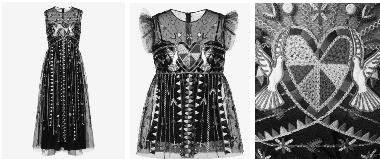
Рисунок 5, 6, 7 – Длинное платье и топ из тюля «point d'esprit» с изысканной и красочной вышивкой фольклорных мотивов [6], [5]

Несомненно, сохранение фольклорных традиций подобным образом, а также их преобладание в fashion -индустрии со старого времени, благоприятно сказывается на вкусах современного поколения, приближая их к осмыслению и популяризации традиционного декоративно-прикладного искусства, где смысловую идею обретает даже не столько сама вышивка, сколько фольклорный мотив, в который заложен определённый смысл инсайта нашей субстанции. Одежда, как восприятие, становится истинным произведением искусства (рис. 8, 9 [4]), которое человек может носить на себе, тем самым отражая свой внутренний мир. И то, что носит кто-то сегодня, возможно, вы захотите носить уже завтра.