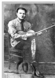
Малюнак 3 – Фота У. Галубка, а таксама адзін з яго сцэнічных строяў і скрыпка на выставе, 2017 [2]