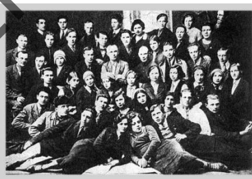
Малюнак 2 – Тroupe Беларускага дзяржаўнага тэатра-3, 1933