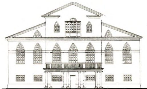
Магілёўская сядзіба «Піленберг». Галоўны фасад сядзібнага дома. Чарцёж.

Сцены былі дэкарыраваны падвойнымі пілястра-мі і ляпнымі абрамленнямі лучковых праёмаў. Гал. фасад завяршаўся 2-яруснымі чацверыковы-мі вежамі з галоўкамі і фігурным франтонам ла-між імі. 2-светлавы інтэр'ер быў багата аздоблены творами мясц. майстроў М. Пігарэвіча і П. Сліжы-ка. Царква не збераглася. Т. І. Чарняўская.