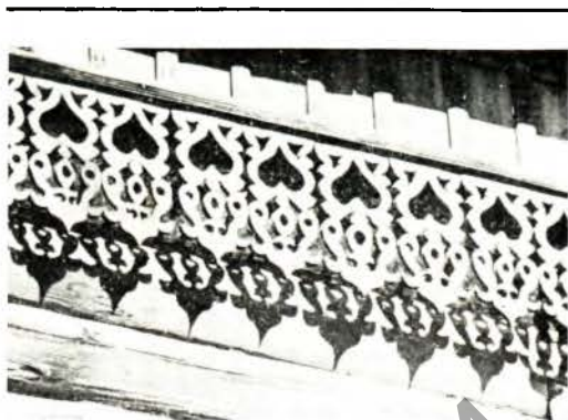
Да арт. Магілёўская разьба. Падзор жылога дома на вуліцы Пляханава, 27.

МАГІЛЕЎСКАЯ РАЗЬБА , арх. дэкор, пашыраны ў Магілёве ў 19—1-й пал. 20 ст.; адносіцца да лепшых узораў разьбы архітэктурнай . Традыцыі склаліся ў 17—18 ст. у жытні пад уплывам стылю барока. Разьба ў выглядзе геам. і расліннага арнаменту (краявая, скразная і правіловачная) паярусна размяшчаецца на фасадах драўляных дамоў.