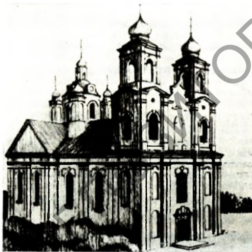
Магілёўская Спасская царква. Малюнак.

МАГІЛЕЎСКАЯ СПАСКАЯ ЦАРКВА. Існавала ў 18—1-й пал. 20 ст. Пабудавана ў стылі поз-няга барока ў цэнтр. частцы Магілёва як гал. храм праваслаўнага Спасакага манастыра. За-кладзена ў 1740; у 1748 знішчана пажарам, у 1756—62 адбудавана (арх. І. К. Глаўбіц). Аднаефавы крыжова-купальны мураваны