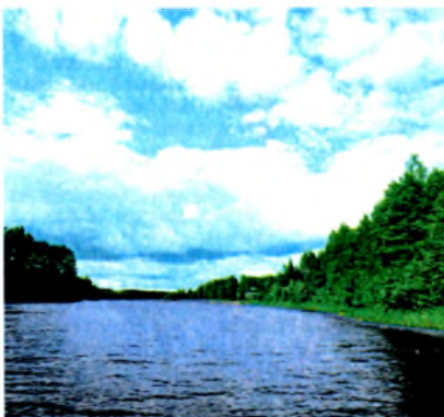
Возера Пліса ў Глыбоцкім раёне.

ПЛІСА , вёска ў Смалявіцкім р-не Мінскай вобл.; чыг. ст. Чырвоны Сцяг на лініі Мінск—Барысаў. Цэнтр сельсавета. За 7 км на У ад г. Смалявічы, 45 км ад Мінска. 356 ж., 150 двароў (2000). Брацкія магілы сав. воінаў, партызан і