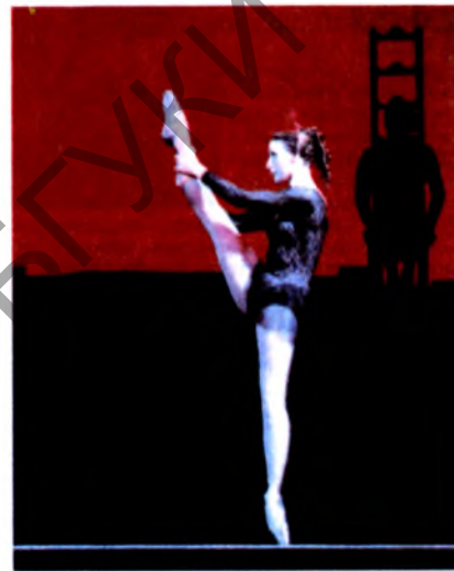
М.Плісецкая ў ролі Кармэн.

ПЛІСЕЦКАЯ Мая Міхайлаўна (н. 20.11.1925, Масква), расійская артыстка балета, балетмайстар. Жонка Р.Шчадрына. Нар. арт. СССР (1959). Герой Сап. Працы (1985). Скончыла Маск. харэаграфічнае вуч. (1943). У 1943—90 — салістка Вял. т-ра ў Маскве. У 1983—84 маст. кіраўнік балетнай трупы Рым. опернага т-ра, у 1988—90 — «Тэатра лірыка насіяналь» (Мадрыд). Творчасці П. уласціва спалучэнне традыцый рус. харэаграфічнай школы з наватарствам сучаснага балета. Яе выканальніцтва выз-