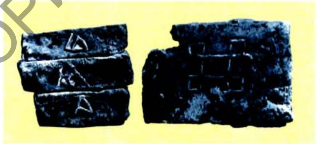
Плінга 12 ст. са знакамі (злева) і клеймамі.

Тв.: Рус. пер. — Естествознание. Об искусстве. М., 1994.