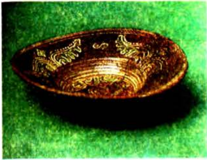
Да арт. Магілёўская кераміка. Талерка. 2-я пал. 17 ст.

МАГІЛЁўСКАЯ КЕРАМІКА , трады- цыйныя ганчарныя вырабы рамеснікаў з г. Магілёў канца 15 — пач. 20 ст. Вы- раблялі посуд, цацкі і інш. прадметы хатняга ўжытку. У канцы 15 — 16 ст. гаршкі з прамой шыйкай і косым ці