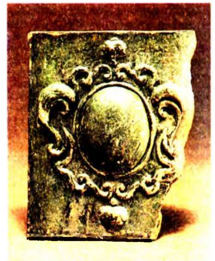
Магілёўская кафля. Паліваная кафля з выявай картуша. 18 ст.