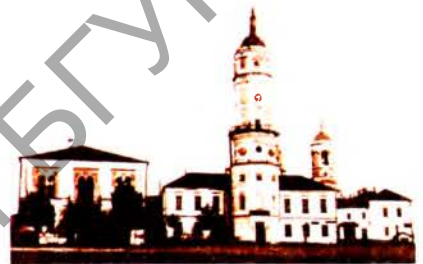
Магілёўская ратуша. Фота пач. 20 ст.

МАГІЛЁўСКАЯ РАТУША . Існавала ў 17—20 ст. у Магілёве. У канцы 17 ст. ратуша — мураваны 2-павярховы буды- нак з 8-граннай 5-яруснай вежай пяс- чэдыне гал. фасада. У 1679—81 пад кі-