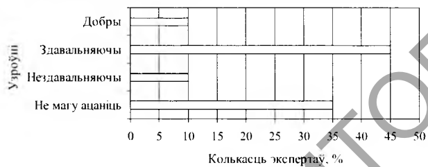
Схема 1 Вызначэнне экспертамі якаснага ўзроўню стану ўзаемадзеяння НББ і рэспубліканскіх бібліятэк у галіне фарміравання фондаў

Праведзенае даследаванне выявіла факт узаемнай неадназначнасці экспертаў у выпадку вылучэння прыярытэтных бібліятэк па ўзаемадзеянні. Так, калі для спецыялістаў ФБ БДУ, ПБ РБ, РНМБ, РНТБ, БелСГБ НАН Беларусі, НПБ ГІАЦ адну з прыярытэтных бібліятэк складае НББ, то для спецыялістаў НББ – Цэнтральная навуковая бібліятэка імя Я. Коласа Нацыянальнай акадэміі навук Беларусі, РНМБ і РНТБ. Спецыялісты НПБ ГІАЦ, ФБ БДУ, РНМБ, РНТБ і БелСГБ НАН Беларусі вылучылі ў якасці прыярытэтнай бібліятэкі ПБ РБ. У той жа час, для спецыялістаў ПБ РБ прыярытэтнымі бібліятэкамі з'яўляюцца толькі НББ і ФБ БДУ. Адзін з экспертаў БелСГБ НАН Беларусі вызначыў у якасці прыярытэтных бібліятэк усе рэспубліканскія бібліятэкі, за выключэннем ФБ БДУ. Бібліятэкі, узаеманапрызнаныя экспертамі прыярытэтнымі, адлюстраваны ў схеме 2.