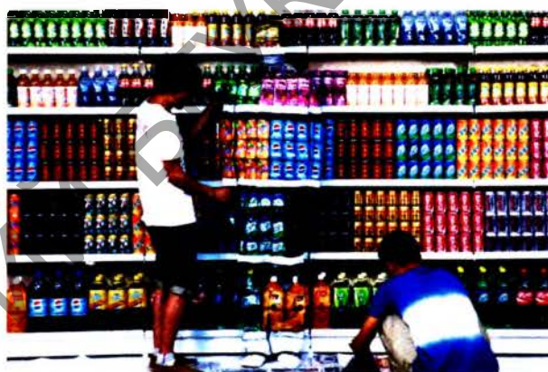
Рис. 4. Лю Болин. Hidden art . Перформанс «Стенд с прохладительными напитками». Пекин. 2011