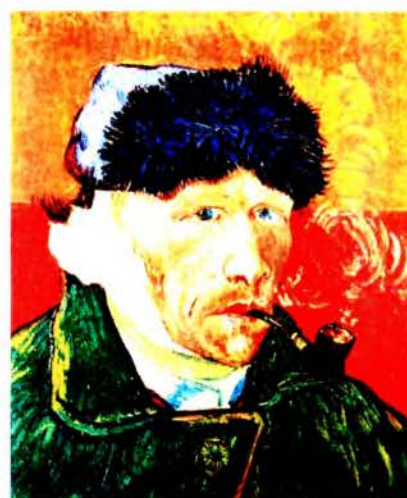
Рис. 8 б. Винсент Ван Гог. Автопортрет с перевязанным ухом и трубкой