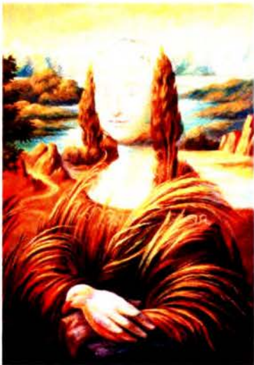
Рис. 2 а О. Шупляк. Пейзаж в итальянском стиле. 2007