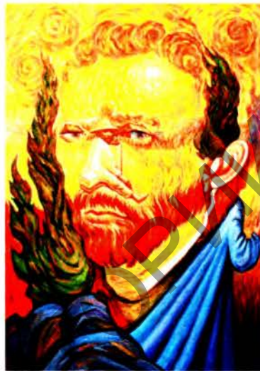
Рис. 2 б О. Шупляк. Двойной портрет Ван Гога. 2011