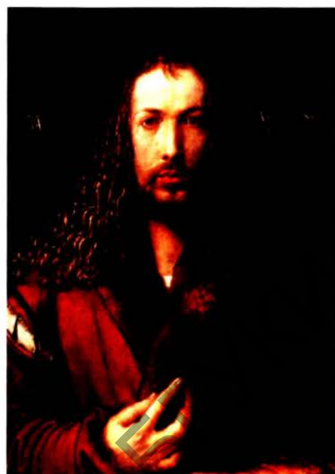
Рис. 6 б. Альбрехт Дюрер. Автопортрет