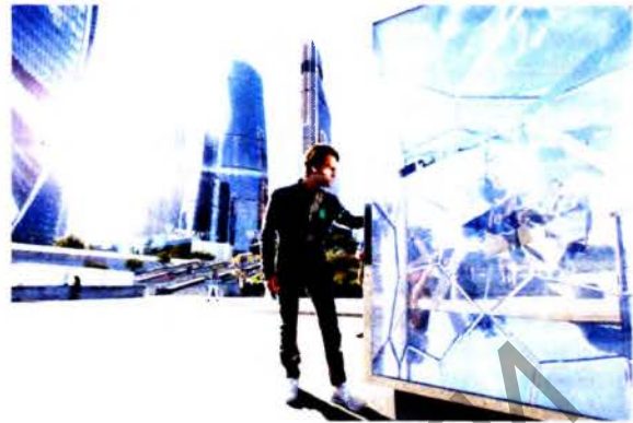
Рис. 1 а, б В. Полякова. Hidden art. Проект «Cubed / Uncubed». Москва. 2017