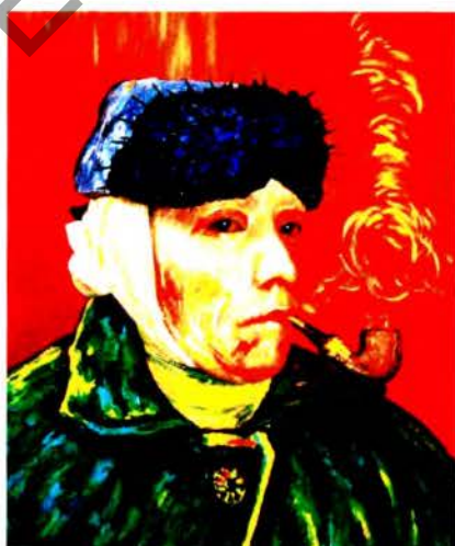
Рис. 8 а. Ясумас Моримура. Портрет Ван Гога