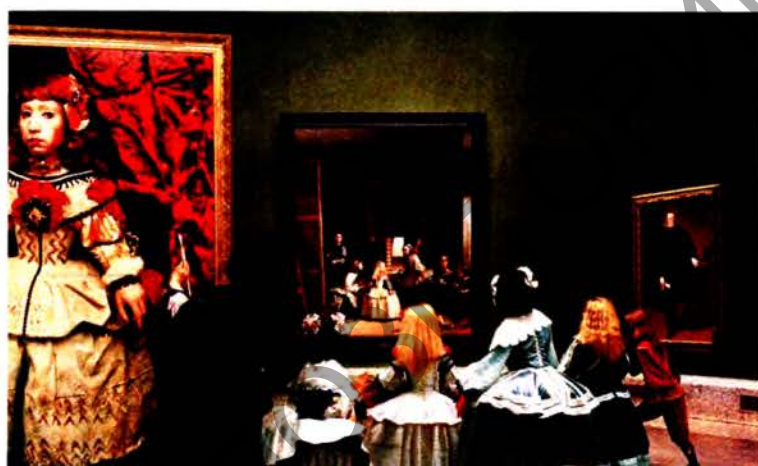
Рис. 7 а. Ясумас Моримура. Менины