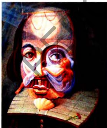
Рис. 2 г О. Шупляк. На театральных подмостках (Шекспир). 2012