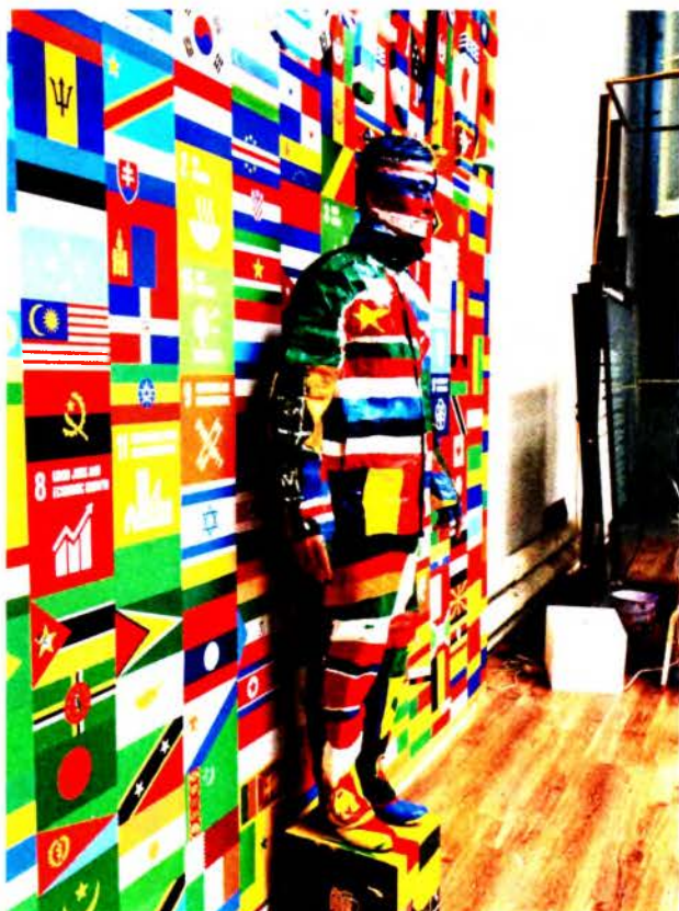
Рис. 5. Лю Болин. Hidden art . Перформанс «Будущее». 2015