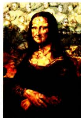
Рис. 3. Лю Болин. Hidden art . Перформанс. Пекин. 2016