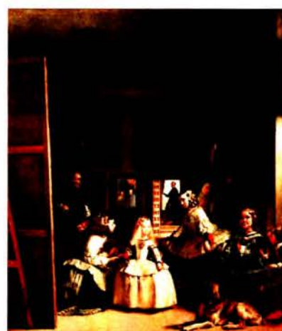
Рис. 7 б. Диего Веласкес. Менины