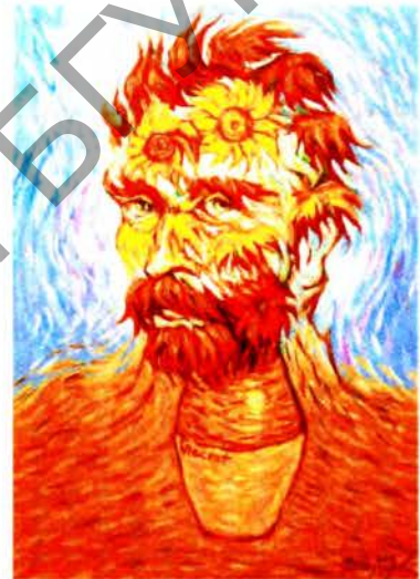
Рис. 2 в О. Шупляк. Подсолнухи. 2017