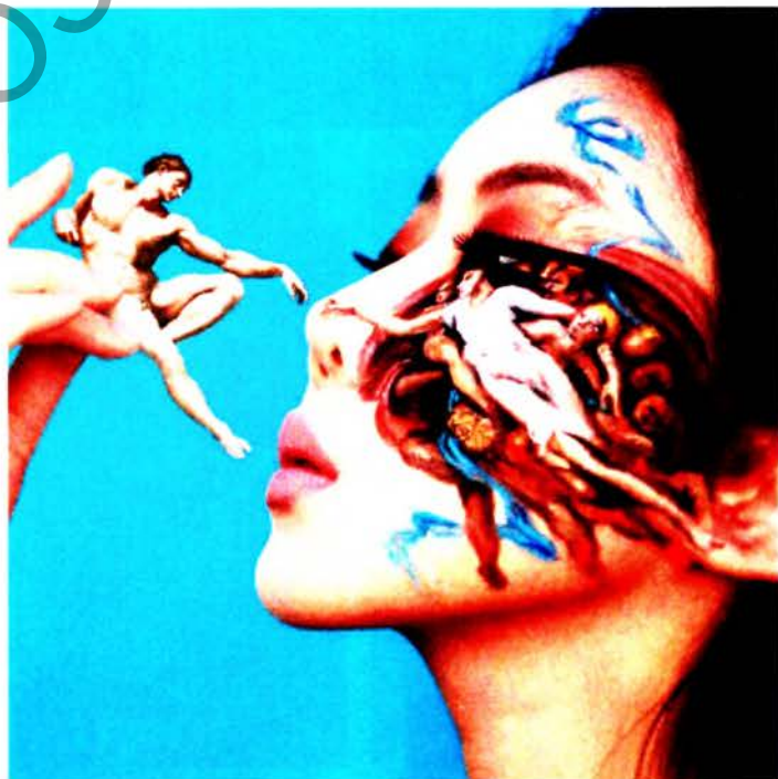
Рис. 9. Дейн Юн. Оптические образы