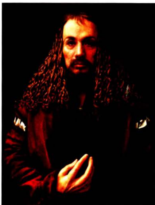
Рис. 6 а. Ясумас Моримура. Портрет А. Дюрера