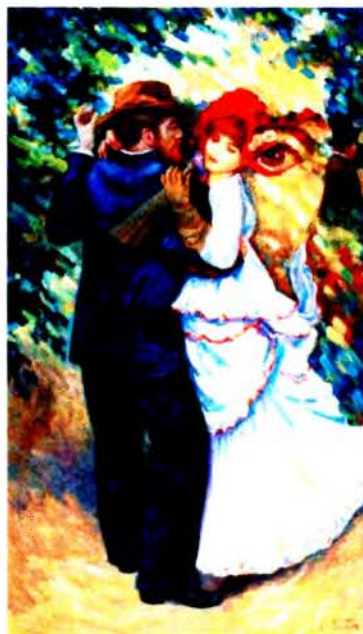
Рис. 2 д О. Шупляк. Танцующий Ренуар. 2012