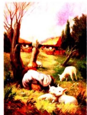
Рис. 2 е О. Шупляк. Мне тринадцать было. 2009