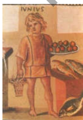
Рисунок 1 – Мозаика «Июнь» (III в., фрагмент)

Календарные мифы свидетельствуют о формировании важнейших для человеческого сознания процессов структурирования хаоса и построения модели временных циклов. Наиболее ранние из дошедших до нас изображений времен года относятся к эпохе античности: они персонифицированы в виде фигур женщин или крылатых гениев, снабженных соответствующими атрибутами. В позднеантичную эпоху получили распространение также художественные аллегории месяцев. В Государственном Эрмитаже хранится фрагмент одного из самых ранних подобных циклов – римская мозаика «Июнь» (начало III в.), изображающая мальчика, окруженного дарами июня – плодами земли и воды. Аллегории месяцев воплощались и в образах людей, занятых соответствующим каждому сезонотрудом (рельефы римской триумфальной арки в Реймсе, III век н. э.).