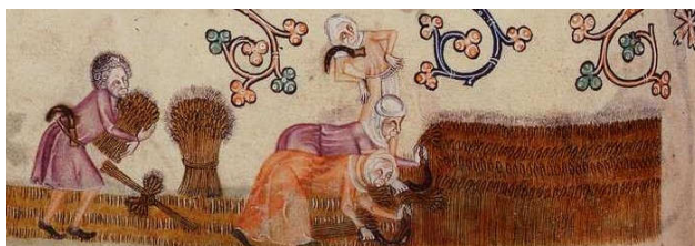
Рисунок 2 – «Заготовка сена» из «Псалтири Латтрелла» (ок. 1330–1340)