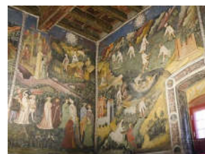
Рисунок 3 – Фрески замка Кастелло-дель-Буонконсильо (ок. 1400)

Античная традиция изображения времен года продолжила свою историю. Средневековому человеку были известны две концепции времени, противостоящие друг другу, как два феномена разных социальных систем, – это «время Бога и природы» (храм) и