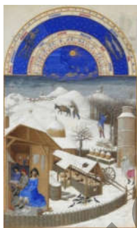
Рисунок 4 – Братья Лимбург Календарь «Великолепного часослова герцога Беррийского» (1413–1416)

В последующие полтора века появилось много работ, подражавших «Часослову» братьев Лимбург например, художники знаменитого «Бревиария Гримани» (ок. 1510–1520, Венеция). Последователи прежде всего развивали декоративно-повествовательную сторону, почти не продвигаясь вперед в реалистическом отражении мира или в его философском осмыслении. Исключением можно считать миниатюры мастерской Симона Бенинга с тонкой разработкой световоздушной среды.