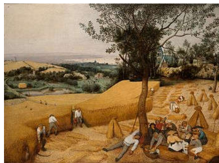
Рисунок 6 – Питер Брейгель Старший «Жатва» (август-сентябрь) из серии «Времена года» (1565)

Для творчества итальянского художника XVI в. Дж. Арчимбольдо характерно стремление к гармонизации различных явлений – стихий природы, основных чувств человека, четырех времени года, что воплотилось в своеобразных портретных сериях. В цикле «Аллегория времен года» (1539) каждый сезон представлен в виде мужского портрета из растений и плодов, соответствующих конкретной ситуации. Авторская концепция и стилистика оригинальны и не характерны для XVI столетия. «Весна» изображает голову мужчины в профиль, составленную из тысяч изображений реально существующих цветов. «Лето» – композиция спелых фруктов и колосьев. Аллегория зимы – это стихия воды, соответственно картина составлена из изображений обитателей подводного мира.