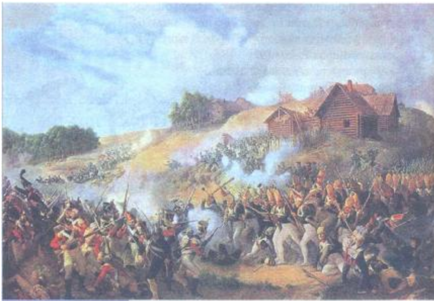
«Бітва каля Клясціц». 19 ліпеня 1812 года

на бойкім шляху з Полацка праз Себеж на Пскоў. Французы імкнуліся аярэдзіць корпус Вітгенштэйна ў сваім імклівым руху на Пскоў і далей на Пецяярбург. Рускія ж ставілі задачу любой цаной прарвацца да себежскага шляху і спыніць ворага. У выніку бітвы французы, нягледзячы на колькасную перавагу над рускімі войскамі, былі спынены, перайшлі да абароны на ўсім сваім паўночным стратэгічным флангу і нават вымушаны былі адступіць да Полацка. Такім чынам, імклівае наступленне французаў на Пецяярбург правалілася. Больш таго, Напалеон вымушаны быў паслаць на дапамогу Н. Удзіно корпус генерала Л. Сен-Сіра, тым самым аслабіўшы галоўную групоўку сваіх войскаў.