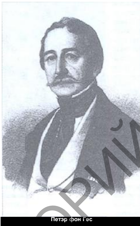
Петэр фон Гес

Сфера навуковых інтарэсаў: гісторыя Беларусі, тэорыя айчыннай і сусветнай культуры.