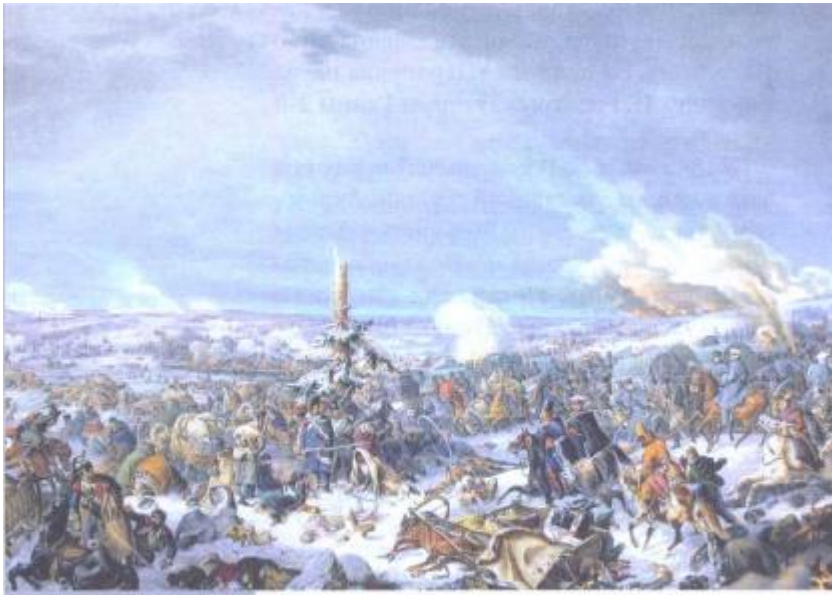
«Пераправа праз Бярэзіну». 16 лістапада 1812 года

Гэты салдат да самай Бярэзіны не толькі захаваў у добрым стане сваю амуніцыю, але і застаўся баяздольным воінам. Кантрастам яму і старому гвардзейцу служаць фігуры абарваных, знямоглых іншых французскіх салдат. Яны захінаюцца ў брудныя анучы, конскія папоны. Іх сутулыя фігуры бачны ўсюды. Частка іх грэецца каля агню, іншыя спрабуюць адабраць адзенне і ежу ў слабейшых. Асаблівыя пачуцці выклікаюць жанчыны і дзеці, якія знаходзіліся пры французскай арміі, а цяпер разам з ёй адступаюць.