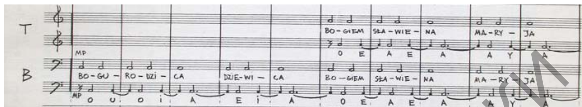
Мал. 3. Фрагмент з араторыі «Багародзіца» В. Кілара [5, с. 8]

матываў з выкарыстаннем адпаведнага вербальнага тэксту альбо без яго. Да прыкладу, у названай вышэй араторыі кампазітар В. Кілар цалкам ужывае две страфы тэксту «Багародзіцы» паводле яго запісу ў «Гісторыі літаратуры незалежнай Польшчы» Ігнацыя Чарноўскага (выд. каля 1974 г.). Музыкальны матэрыял даўняга гімна гучыць толькі фрагментарна.