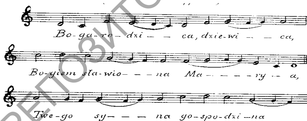
Мал. 2. «Багародзіца» [2]

Даследчык Іеронім Фейхт на падставе дэталёвага музычна-тэксталагічнага аналізу «з пэўнай асцярожнасцю» сцвярджае, што «мелодыя “Багародзіцы” ў X–XI ст. узнікнуць не магла, бо вельмі ясна і шматліка прысутнічаюць у ёй сляды матывікі і меладыйных абаротаў XII–XIII ст.» [4, с. 149]. Пры гэтым, паводле слоў Здзіслава Яхімецкага, «у цэлым як мастацкі твор “Багародзіца” з’яўляецца песняй арыгінальнай, нягледзячы на відавочную роднасць яе матываў са шматлікімі матывамі сярэдневяковай манодыі» [пав. 4, с. 149].