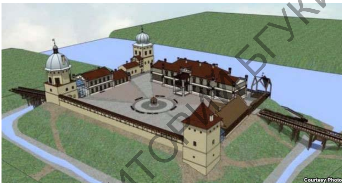
Мал. 2. Праект 2012 г.

З 2011 г. ТАА «Цэнтр па рэгенерацыі гісторыка-культурных ландшафтаў і тэрыторый» вялася карэкціроўка праекта 2004 г. і распрацоўка новага будаўнічага праекта рэстаўрацыі Брамнай вежы на аснове праведзеных у 2009–2010 гг. натуральных даследаванняў Брамнай вежы [2]. Але замест цэластнага будаўнічага праекта рэстаўрацыі Брамнай вежы гэтым праектам было прадугледжана толькі рэканструкцыя купальнага завяршэння.