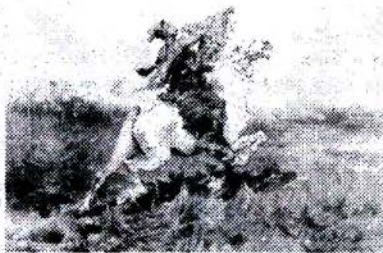
Мал. 4. Серыя карцін польскага мастака Юзэфа Брандта (1841–1915) з выявамі казакаў, 1867–1910 гг.