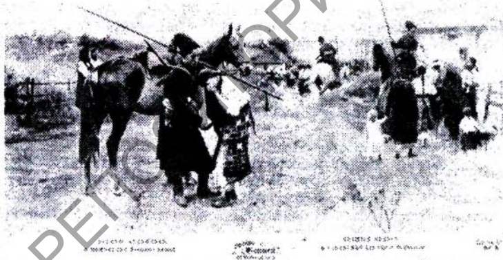
Мал. 5. Побит казаків у виявах на паштоўках пачатку ХХ стагоддзя (прыватны збор аўтара)

Тое, што казак як правіла мае час на самадасканаленне, заняткі мастацтвам, сцвяржае шэраг фальклорных тэкстаў беларускіх песень, апісваючых стаўленне казакаў да мастацтва. Паводле апошніх, ён ці сам валодае музычнымі інструментамі, ці наймае музыкаў, якія імі валодаюць, ражком і трубой: «Зайгралі ў ражок. / Як ішлі мы пад гару, / Зайгралі ў трубу» [8, 143], [8, 143], – скрыпкай і дудкай [8, 66, 67, 68, 136, 160], бандураю [6, 268], барабанам [8, 66, 67, 145].