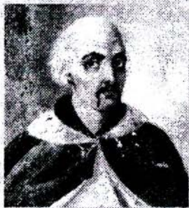
Мал. 3. Казакі ў мастацтве XVII стагоддзя: партрэт Севярына Налівайкі (злева) і выява палка Марціна Небабы ў Гомелі, 1649 год (справа)