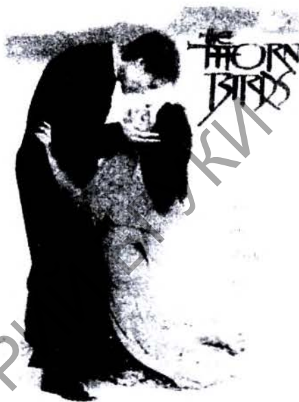
Рис. 2. Постер фильма «Поющие в терновнике» (англ. The Thorn Birds), 1983 [3]

Автором музыки к фильму «Унесённые ветром» является Макс Стайнер, американский кинокомпозитор, дирижёр (1888–1971). В 1939 г. М. Стайнер пишет поистине шедевральную музыку для компании «Warner Bros.» к названному фильму. На весь сценарий для написания этой музыки у него было только три месяца времени. В 1940 г. Стайнер был номинирован на «Оскар», но не получил его, хотя музыка из фильма «Унесённые ветром» заняла второе место в списке «Лучшая музыка в американских фильмах за 100 лет» по оценке Американского института киноискусства