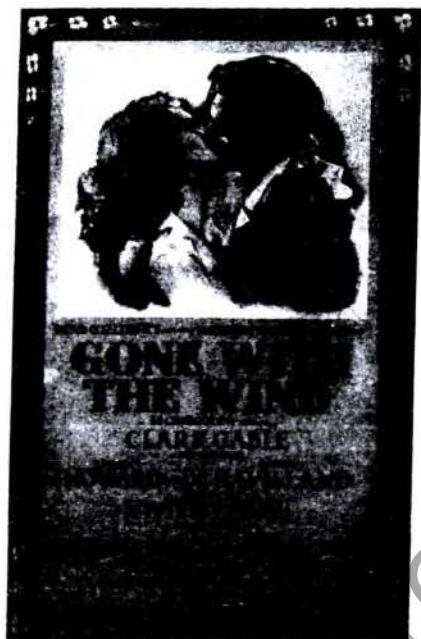
Рис. 1. Постер фильма «Унесённые ветром» (англ. Gone With the Wind). 1939 [4]

впоследствии стали кинобестселлерами. Но почему данные кинокартины приобрели такую популярность? Дело в том, что одним из залогов их успеха стала музыка, написанная к каждой из этих кинокартин.