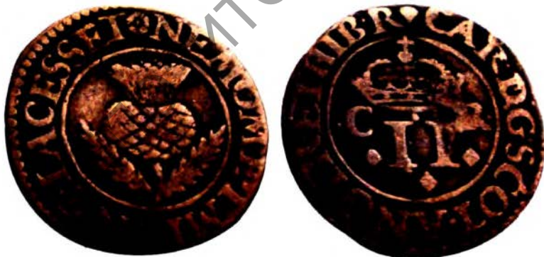
Шатландыя. Карл I (1625 – 1649). Торнар (двайны пені), 1632 – 1633 гг. (манета з асабістай калекцыі)