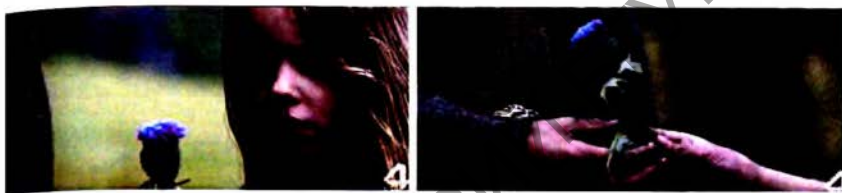
Чартапалох. Кадр з фільма «Храбрае сэрца», 1995 г.