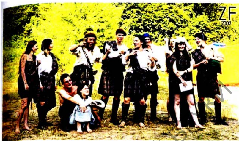
Фэст «Шатландскі Чартапалох», Беларусь. Фота ўдзельнікаў Клана макМорданс (амаль што ў поўным складзе).