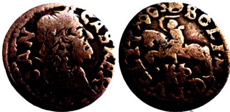
Вялікае княства Літоўскае. Ян II Казімір Ваза (1649 – 1668). Солід (шэлег), брэсцкая чаканка. 1665 г. (манета з асабістай калекцыі)