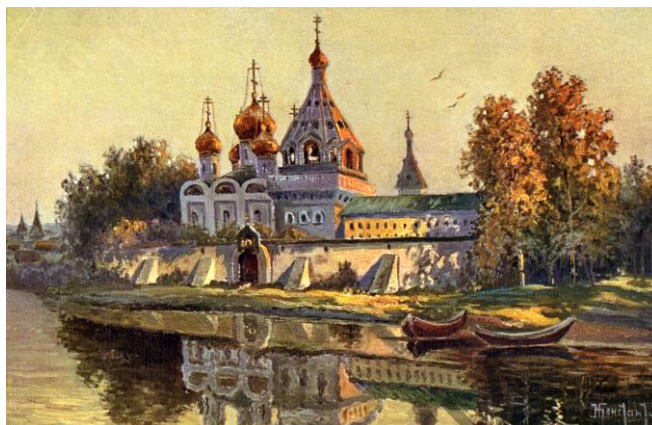
Рисунок 3 – Константинов. Ипатьевский монастырь на реке Волге, где в XVII ст. был избран на царство Царь Михаил Фёдорович из Дома Романовых

В память столь непостижимого пришествия Образа Небесной Заступницы в Кострому (случившегося подле живописного местечка Запрудни) в России было установлено первое празднество Божией Матери, именуемой Феодоровской, 16 августа (29 августа по новому стилю). Именно с той поры средневековая Кострома стала временной сакральной столицей Руси, а позднее – и местом выдвижения на престол первого царя из Дома Романовых (рис. 2), где мать Михаила Романова, инокиня Марфа, благословила его на царство именно Феодоровской иконой Богородицы. Произошло это в местном Ипатьевском монастыре (рис. 3), а 14 марта (27 марта по новому стилю) 1613 года М.Ф. Романов был избран на царствование Земским собором (рис. 4). В память этого события было установлено второе празднество (главное), а сама икона стала родовой покровительницей Дома Романовых (рис. 5).