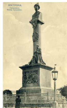
Рисунок 6 – Памятник И. Сусанину, Кострома. Изд. Маг. А.Д. Белянкина (открытка из коллекции автора)

Более чем 300 лет Романовы благополучно царствовали в России (рис. 7). Многие российские царицы и княгини иностранного происхождения получали отчество Феодоровна в честь фамильной иконы рода при переходе в Православие (рис. 8). Феодоровская – Костромская – икона Божией Матери, по преданию, написана евангелистом Лукой и близка по иконографии к Владимирской иконе Богородицы. Икона получила своё название в честь Св. Феодора Стратилата. Феодор также было именем, которое носил в крещении отец Александра Невского – Великий князь Ярослав Всеволодович (рис. 9). Предполагается, что именно этой иконой Ярослав благословил своего сына, князя Александра, на брак с княжной Александрой Брючиславовной (в некоторых источниках Параскевой), дочерью полоцкого князя Брючислава Васильковича.