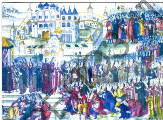
Рисунок 4 – Встреча Великого Московского Посольства М.Ф. Романовым у Костромского Ипатьевского монастыря 14 марта 1613 г. Литография, середина XIX в. (современная полиграфическая продукция из коллекции автора)

С основателем династии Романовых связано предание о подвиге Ивана Сусанина. Когда инокиня Марфа со своим сыном Михаилом укрывались от тягот Смутного времени на костромской земле, польские оккупанты усердно искали Михаила с намерением убить избранника на царство [3]. На пути интервентов оказался простой крестьянин – Иван Сусанин, который, под предлогом указать полякам путь, заводит их в непроходимые болота, где сам принимает мученическую смерть. Подвиг Сусанина активно вдохновлял деятелей русского искусства, стал основой оперы М. Глинки «Жизнь за царя». До революции на главной площади Костромы стоял величавый памятник царю Михаилу Романову и спасшему его жизнь костромскому крестьянину Ивану Сусанину (рис. 6).