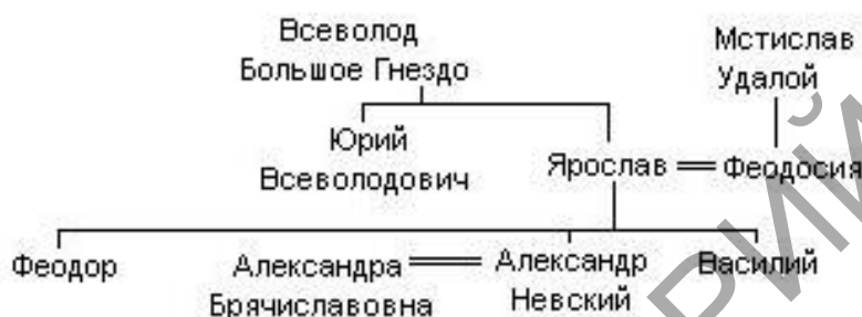
Рисунок 9 – Родословное древо князя Александра Невского [4]

Оригинал Феодоровской иконы – двухсторонний. На обороте – образ Св. Параскевы (рис. 10), изображённой в богатом княжеском одеянии (Св. Параскева, наречённая Пятницею у славян почиталась как покровительница свадеб).