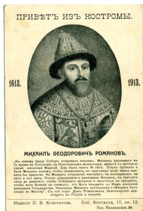
Рисунок 2 – М.Ф. Романов, 1613-1645 (открытка из коллекции автора) [2]