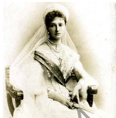
Рисунок 8 – Будущая Императрица А.Ф. Романова, 1894 г.

Оригинал Феодоровской иконы – двухсторонний. На обороте – образ Св. Параскевы (рис. 10), изображённой в богатом княжеском одеянии (Св. Параскева, наречённая Пятницею у славян почиталась как покровительница свадеб).