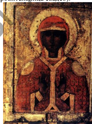
Рисунок 10 – Св. Параскева, XII/XIII века (оборот Феодоровской иконы, XII в.) [5]