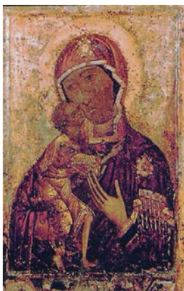
Рисунок 1 – Феодоровская икона Божией Матери, XII век [6]

святыня Православия (четвертый по значимости для Русской Православной церкви образ Богородицы), чудесное явление которой произошло между 1272 и 1274 годами.