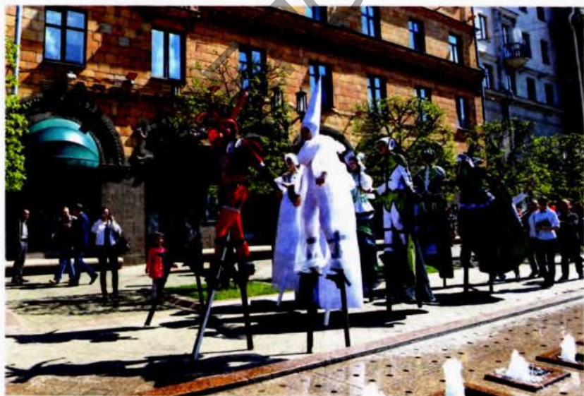
▼ Карнавальное шествие во время форума уличных театров. Минск, 2016 год