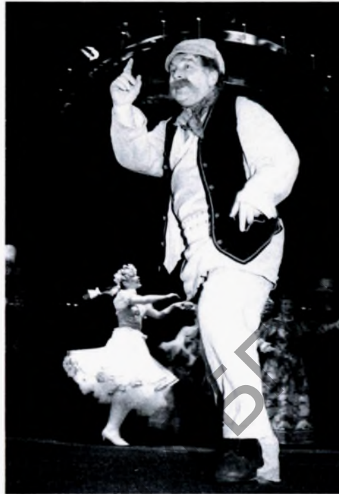
◀ Спектакль Национального академического драматического театра имени Янки Купалы по пьесе В. Дунина-Марцинкевича «Идиллия». В роли Наума Приговорки – народный артист Беларуси Геннадий Овсянников. 1994 год

Рассказывая о развитии драматического репертуарного театра в Беларуси, Р. Бузук подчеркнул, что в конце XX века идеологическое давление на деятелей театра постепенно слабело. Заговорили о реформах в театре, в частности, о коммерциализации. Впрочем, эта тенденция, когда все творческие задумки режиссера должны пройти через горнило коммерциализации, сохранилась и в наше время. А тогда, в годы кардинальных трансформаций белорусского театра, хозяйственно-экономические условия существования вынуждали расширять