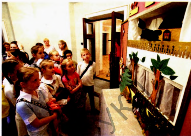
▲ Во время открытия обновленного здания Белорусского республиканского театра юного зрителя. 1 июня 2015 года

Ростислав Леонидович по первому образованию музыкант. Увлечение музыкой началось в школьные годы в Баку, но о том, что он учится еще и в музыкальной школе,