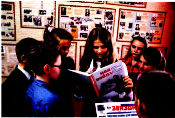
В школьным музеі СШ № 45 Мінска

ло в целом сохранить необходимую сеть учреждений дошкольного образования.