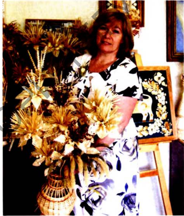
Солнечный свет белорусской соломки

ных для работы с детьми. Все это потребовало от руководства страны принятия неотложных мер. В 1992 г. Верховным Советом Республики Беларусь было принято постановление «О сохранении и развитии сети детских дошкольных учреждений».