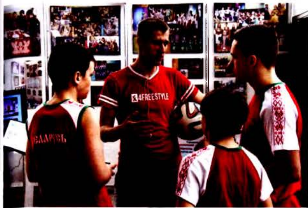
Интерес к спорту неподдельный

начальной школы определено развитие у ребенка устойчивого интереса к обучению, освоение базовых навыков учебной деятельности. Базовая школа – это учреждение общего среднего образования детей и подростков с I по 9 класс, а средняя школа – это учреждение, обучение в котором происходит с I по II класс. Базовая школа несет основную нагрузку по реализации задач общего среднего образования, подготовке детей к жизни и труду в обществе. Программа базовой школы характеризуется логичной завершенностью и полнотой знаний, которые предоставляются в рамках государственного стандарта. Средняя школа реализует важнейшую задачу подготовки к выбору профессии, формирования гражданских и патриотических качеств 1 .