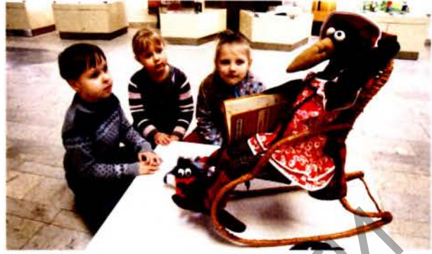
Сказочный герой в глазах детей

В Беларуси основными ступенями образования являются: дошкольное, общее базовое (на базе 9 классов средней школы), общее среднее (на базе 11 классов), начальное профессиональное и среднее специальное. Важный вклад в формирование подрастающего поколения вносят дошкольные учреждения страны, которые направляют свои усилия на развитие ребенка в возрасте от 2 до 6 лет. Динамика их развития достаточно показательна в связи с демографическим кризисом. Именно в 1990-е гг. стали очевидными негативные явления в системе дошкольного образования и воспитания, что обусловило сокращение данных учреждений, особенно ведомственных 3 . Многие детские сады находились в аварийном состоянии, в зданиях, не приспособлен-