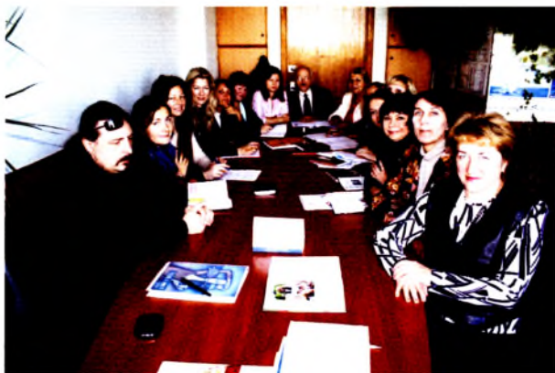
Белорусский государственный университет культуры и искусств, кафедра менеджмента социокультурной сферы. 2011 г.

В складывающихся условиях полиэтнической и поликультурной среды высшая школа Беларуси становится важнейшим центром продвижения идей поликультурного образования, а студенческая молодежь, включаясь в процессы интернационализации, – главным субъектом поликультурного обучения. Студенческая молодежь – это категория граждан Беларуси, с которой связываются оптимистические прогнозы в дальнейшем развитии страны, потому что она рассматривается прежде всего как новое поколение интеллектуальной элиты. Высшая школа – это институт социализации, институт «возвращения» профессионалов, специалистов в разных сферах общественной жизни, и именно в высшей школе происходит становление личности молодого человека, формирование его социальной позиции, нравственной зрелости.