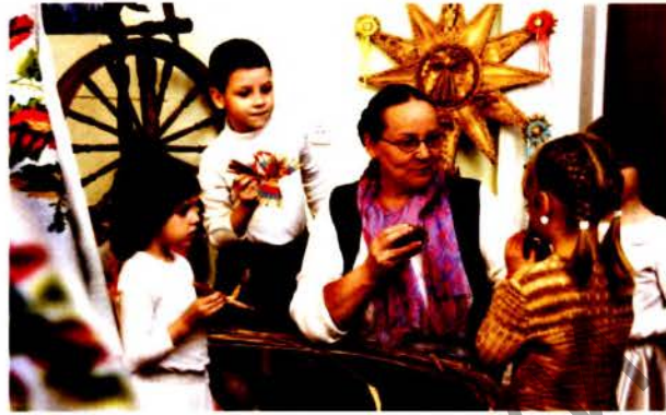
Руководитель детского фольклорного ансамбля «Зорачка» Национального центра художественного творчества детей и молодежи

В рамках деятельности ассоциированных ЮНЕСКО школ проводится существенная научно-практическая работа в ходе конференций, семинаров, круглых столов. Заслуживает внимания семинар «Ассоциированные школы Беларуси в XXI веке: приоритеты, проблемы, перспективы» с участием национальных координаторов ассоциированных