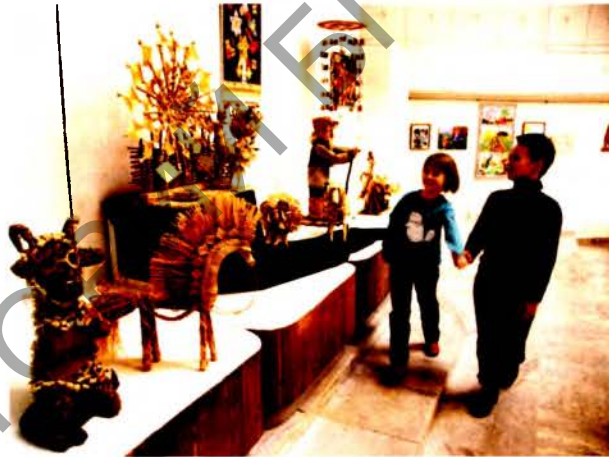
В Национальном центре художественного творчества детей и молодежи

школ ЮНЕСКО России, Молдовы, Грузии, Армении, Польши и Латвии (2002 г.). В рамках семинара состоялось обсуждение возможных направлений деятельности школ-участниц проекта на национальном и региональном уровнях. По итогам семинара принята резолюция, в которую вошли предложения участников семинара по возможным направлениям и формам сотрудничества в рамках кластера и на межрегиональном уровне.