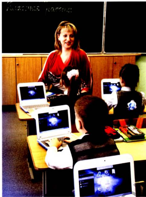
Информационные технологии в помощь учителю

по-прежнему является важнейшим источником информации. А вот уже для новых поколений XXI в. телевизор – это уже отжившая технология. Сегодня Всемирная паутина – Интернет – служит важнейшим каналом коммуникации. Телевизионная культура и Интернет формируют разный тип личности. Поколение телевидения выступает пассивной стороной – они воспринимают информационную повестку, которую формируют для них другие люди. Представители поколения Интернета, напротив, являются активными участниками поиска информации. Пользователи сами выбирают сайт, чью новостную рассылку они хотели бы получать. Так культивируется новый тип мировой экономической модели, основанной на массовом сотрудничестве.