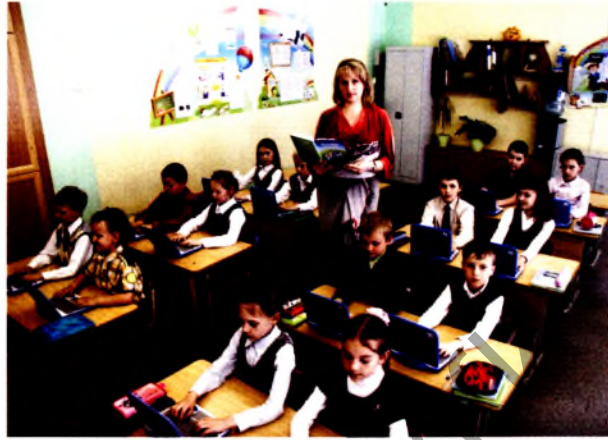
Мой компьютер – самый лучший

Весь XX и начало XXI века прошли под знаком радикальных преобразований во всех сферах жизни белорусского общества. Важнейшим ресурсом динамичного и поступательного движения стано-