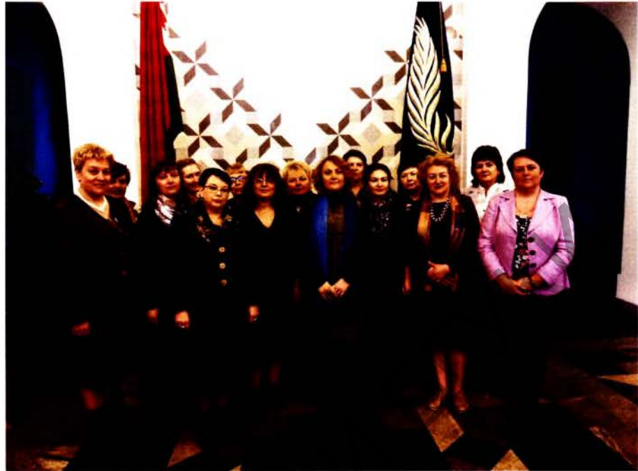
Союз женщин БГУ. 2016 г.

го государственного университета (далее – ЦСПИ БГУ), наблюдается рост числа молодых людей, удовлетворенных уровнем полученного образования, и снижение количества «категорически неудовлетворенных». Индекс удовлетворенности уровнем образования подтверждает положительную динамику в среде белорусской молодежи.