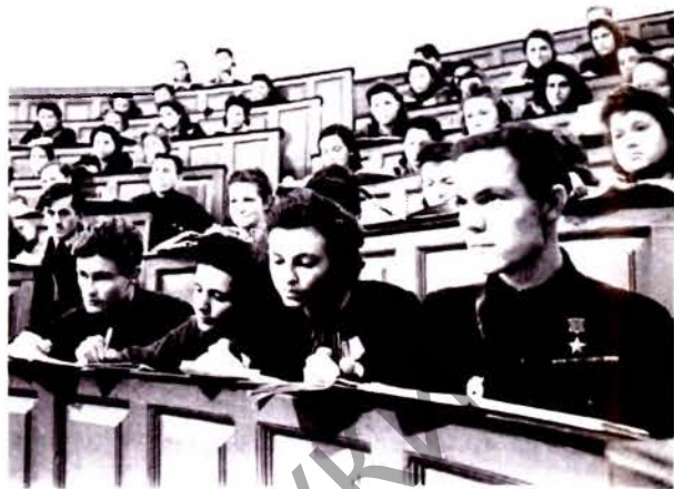
Студенты послевоенных лет

заведений. В них обучались соответственно 21,5 и 35 тыс. чел.