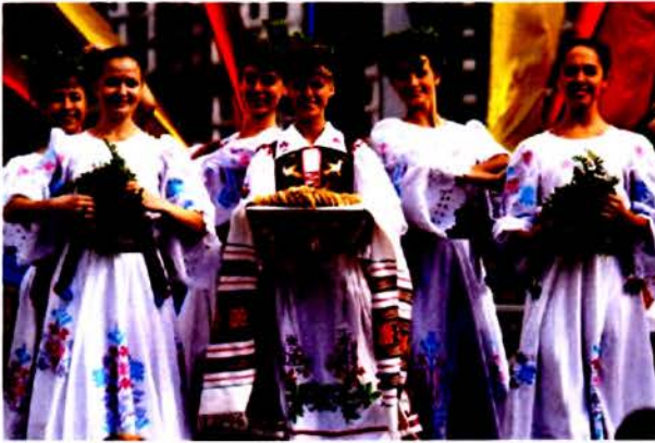
Студентки Белорусского государственного университета культуры и искусств

В учреждениях профессионально-технического образования численность юношей практически в 2 раза больше численности девушек. Это во многом связано с тем, что в белорусском обществе специальности, предлагаемые учреждениями профессионально-технического образования, воспринимаются исключительно как «мужские».