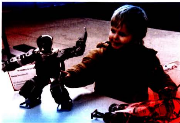
Мой друг робот

Принята новая концепция информатизации системы образования на период до 2020 г. Ученик может использовать средства информации не только в учебном процессе, но и в процессе подготовки домашних заданий. Электронный учебник, элек-