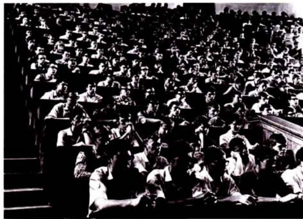
Поточная аудитория в вузе