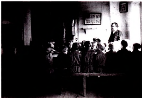
Первые уроки. Досоветский период.

ли создаваться национальные школы, а также учебные заведения более высокого типа. Так, в 1916 г. в местечке Свислочь состоялось открытие Белорусской учительской семинарии. После Октябрьской революции борьба за национальную школу не прекращалась и в условиях польской интервенции. Однако заняться переустройством народного образования с учетом национального фактора стало возможным только после второго провозглашения Белорусской Советской Социалистической Республики в 1920 г. В принятой декларации указывалось на необходимость установления полного языкового равноправия в учреждениях образования. Это касалось белорусского, русского, польского и еврейского языков. Народному комиссариату просвещения