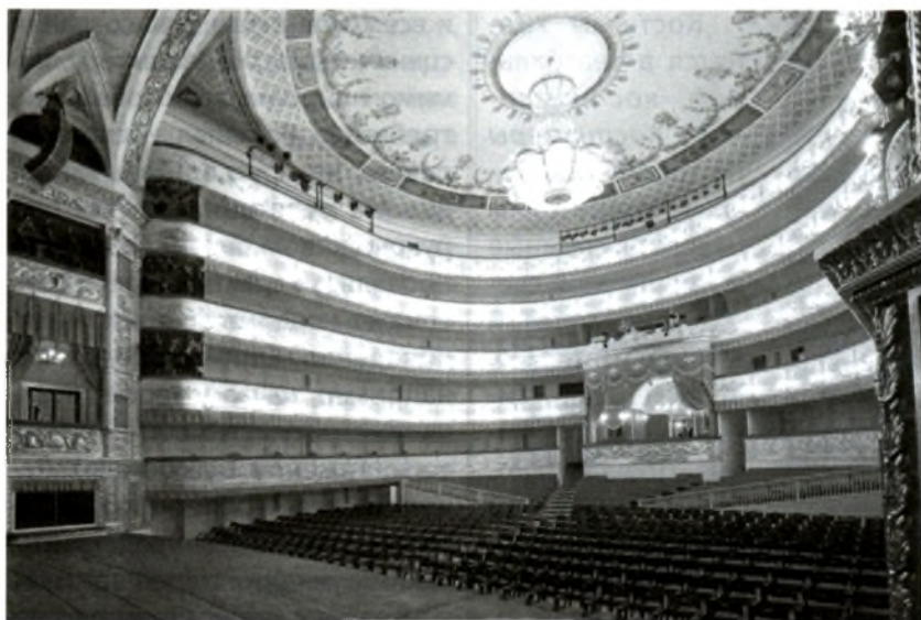
Зрительный зал Александринского театра (Санкт-Петербург)

ную одежду в гардеробе, зрители направляются в фойе (французское слово). Фойе — это специально оформленные помещения, где зрители гуляют и общаются перед началом спектакля и в антрактах. В фойе обычно развешаны фотографии актёров, на них зрители могут рассмотреть своих любимцев без грима. Из фойе проходим в зрительный зал.