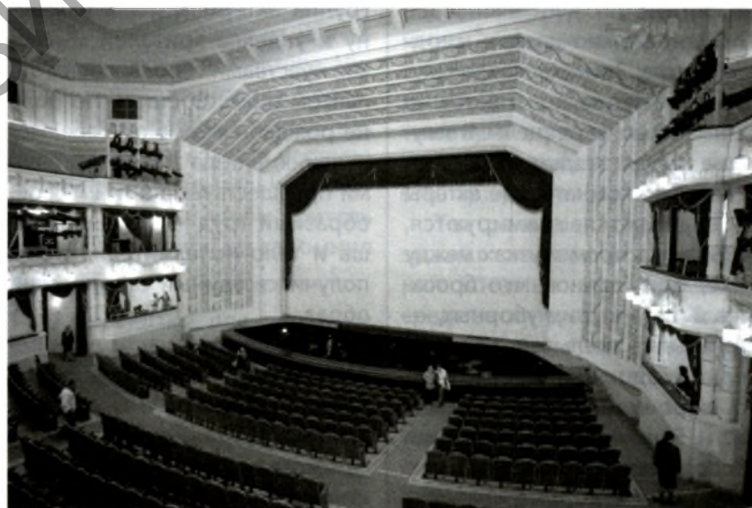
Сцена Большого театра Беларуси, построенного И. Лангбардом, имеет мощный портал

Для получения разнообразных сценических эффектов сцена оборудована специальными осветительными приборами. В основе каждого такого прибора — сильная лампа, часто прикрытая цветным прозрачным фильтром, отчего световой луч делается окрашенным. Каждая лампа, освещающая сце-