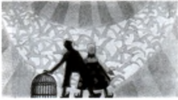
В. Егоров. Эскиз к спектаклю по пьесе М. Метерлинка «Синяя птица»

Помимо эскизов, художники-сценографы готовят макеты декораций. Это делается для того, чтобы участники спектакля могли заранее представить, как будут выглядеть все элементы оформления в пространстве сцены.