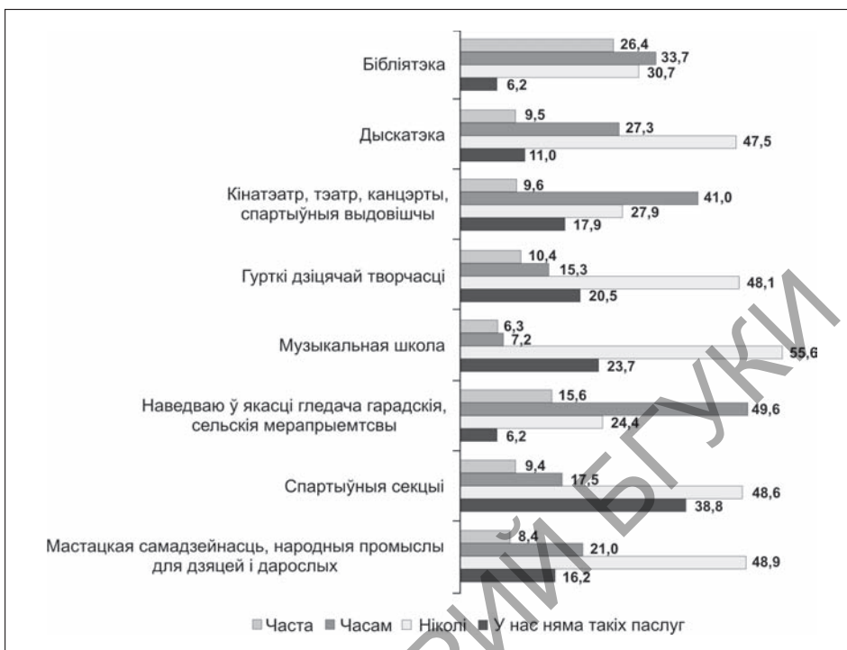
Мал. 1. Размеркаванне адказаў на пытанне «Як часта Вы альбо Ваша сям’я карыстаецца культурна-адпачынкавымі паслугамі?» (2014 г.), у %

Сярод асноўных прычын нізкай уключанасці сельскага насельніцтва ў культурна-адпачынкавую сферу — слабая актыўнасць сялян: аб адсутнасці часу для наведвання ўстаноў культуры вольнага часу заявіла больш за 40 % рэспандэнтаў (40,2 % — у 2011 г. і 44,6 % — у 2014 г.) (гл. мал. 2). Характэрнай асаблівасцю сельскага ўкладу жыцця з’яўляецца высокая доля фізічнай працы і сумяшчэнне занятасці ў вытворчасці з вядзеннем хатняй гаспадаркі. Гэта адымае значную частку часавых рэсурсаў: больш за палову жыхароў сяла, па даных апытанняў, працуюць на прысядзібным участку, вядуць гаспадарку ў вольны ад працы час.