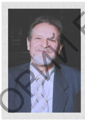
Малюнак 2 – В.П.Рагойша, 2016