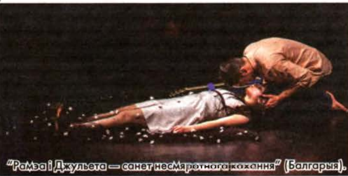
“Рамэа і Джульета — санет несмяротнага кахання” (Балгарыя).

пластычным тэатр... Спектр тэатральных стыляў і кірункаў таксама ўрахваў. Асабліва канцэптuallyны шарм фестывалю ў цэлым надало біенале пластычных мастацтваў “Куфар-пластылін”. Пластыкай форум пачаўся, калі спецыяльны госць “Куфра” маладзёжны тэатр “Кола” з Віцебска паказаў спектакль “Папяровыя людзі”, пластыкай зачароўваў (“[Ма:]” тэатра танца Tremors Беларускага дзяржаўнага ўніверсітэта інфарматыкі і радыёэлектронікі і “Кніга кніг: жывыя гравюры” Беларускага дзяржаўнага ўніверсітэта культуры і мастацтваў),