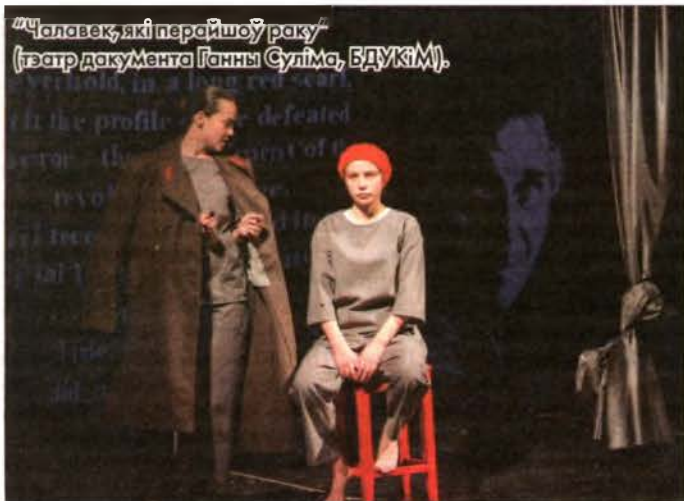
“Чалавек, які перайшоў раку” (тэатр дакумента Ганны Суліма, БДУКІМ).

Гэтая тэма сустрэчы і — не ў меншай ступені — адзіноты, якая, як правіла, вымушае людзей шукаць сустрэчу ці якой іншы раз заканчваецца сустрэчы, была, мабыць, скразной і самай галоўнай у спектаклях фестывалю. Усе героі сёлетняга “Куфра” былі вельмі адзінокамі: Рамэа і Джульета, Медэя, Эдып, Меерхольд, юны лекар з апавяданняў Булгакава, амерыканскі школьнік, зацкаваны