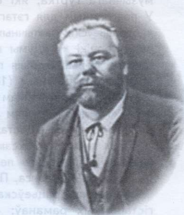
Іван Казіміравіч Кандрацэў (1849–1904)

У 1868 г. у «Віленскім весніку» быў апублікаваны першы верш І. К. Кандрацэва «Вільня 22-га кастрычніка 1868 г.». Праз паўгода там жа надрукаваны верш «Прачысценская царква». У наступным годзе «Віленскі веснік» змяшчае на сваіх старонках яшчэ некалькі вершаў маладога паэта («Вільня», «3 кожным годам у краі нашым...», «19 лютага», «3 натуры»).