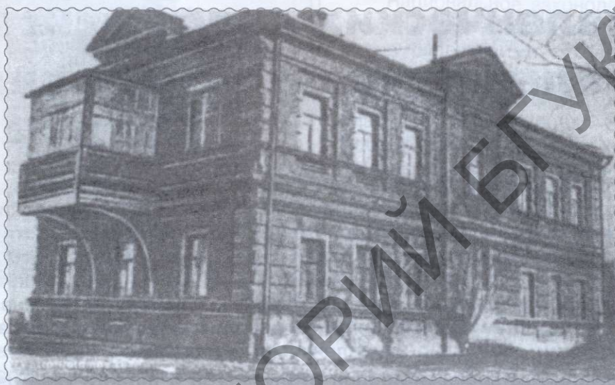
Дом на вул. Каланчэўскай у г. Маскве, дзе знаходзілася кватэра І. К. Кандрацьева

І. К. Кандрацьеў з'яўляецца аўтарам 700-старонкавага нарыса «Седая старина Москвы», які вялікімі тыражамі перыядычна выдаецца і ў нашы дні (1999, 2006, 2008). Нашым суайчыннікам напісаны і гістарычны даведнік «Маскоўскі Крэмль».