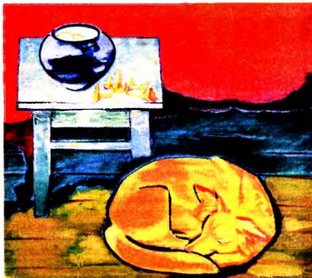
Яўген Ціханаў «Шчасце ёсць».

— Я жывапісец па адукацыі. Гэта і ёсць мая асноўная спецыяльнасць. Аднак людзі на маіх палотнах