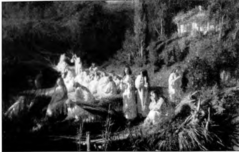
И. Крамской. «Майская ночь. Русалки». 1871 г.

растительностью русалки сочетают в себе черты водных духов и признаки духов плодородия, «подательниц» живительной влаги. Сами сроки их переселения на землю свидетельствуют об их продуктивной, вегетативной функции. Выход русалок из воды на сушу происходит тогда, когда почва более всего нуждается в дожде, способствующем хорошему урожаю, в период цветения злаков, на границе весны и лета.