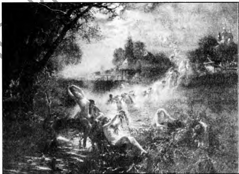
К. Маковский. «Русалки». 1878 г.

Как мы уже могли заметить, славянская русалка прочно связана не только с водой,