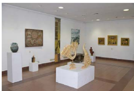
Экспозиция с работами выпускников народного ДПИ БГУКИ