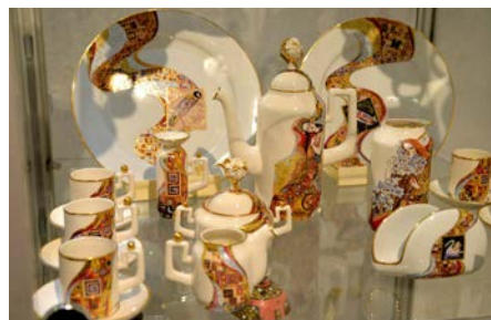
Произведения авторов из Гжели

Таким образом, укрепление и развитие международного культурного сотрудничества стало одним из центральных направлений деятельности галереи. С большим успехом прошли выставка эстонской графики «MINIPRINT Талін – Мінск 2016», выставка лоскутного шитья авторов Беларуси, России и Латвии «Трикотажные куплеты – 2016», фотовыставка «Все дороги ведут в... Италию» членов известного итальянского фотоклуба «Дженсано-ди-Рома». На выставке «Прыпавесці» Международного пленэра иконописи в Новицах были представлены иконы авторов Беларуси, Польши, Украины и Грузии. По случаю Дня Конституции Словацкой Республики и председательства Словакии в Совете Европейского Союза галерея представила выставку одного из самых известных словацких художников Зузаны Граус Рудавайской «Прикосновение Словакии. Рисунок. Объект. Драгоценность».