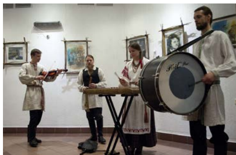
Ансамбль «Раме» на выставке «Экавясна и маладосць»