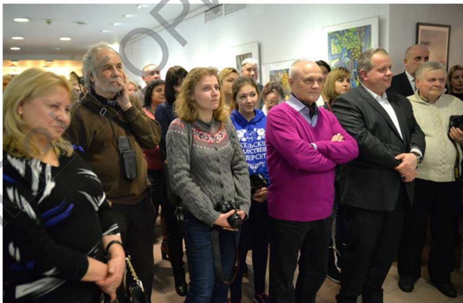
На выставках в галерее всегда аншлаги

В настоящее время галерея инициировала и дала старт ряду культурно-просветительских программ. Среди них долгосрочная программа «Диалог культур», включающая в себя цикл выставок представителей белорусского зарубежья и национальных меньшинств, проживающих в на-