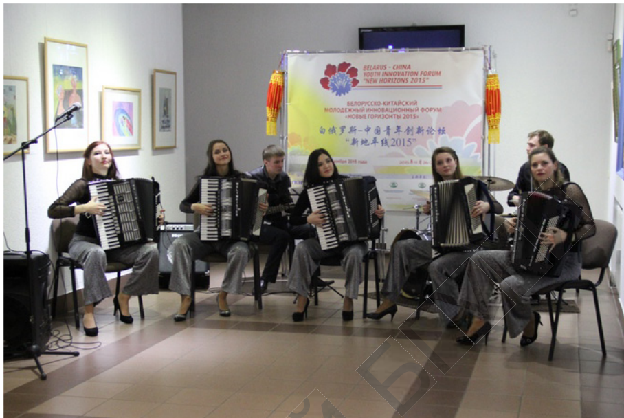
Ансамбль аккордеоністаў «Тутці» адкрывае беларуска-кітайскую выставку «Созидатели будущего»