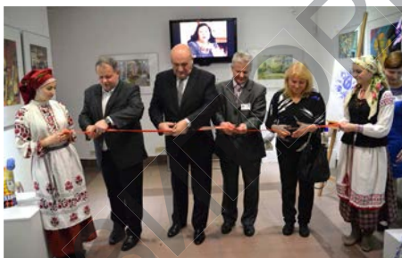
Открытие выставки «Гжель – Минск: истоки творчества и мастерства»