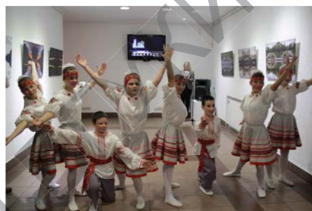
На открытии выставки «Мир глазами ребенка»