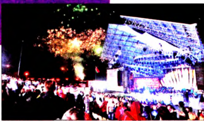
В подарок меломанам — роскошные георгины шоу-бизнеса.

дождь не останавливают публику, спешащую на встречу с прекрасным. В минувшие выходные в амфитеатре она стойко выдержала череду концертов под открытым небом. Удивительные люди, отзывчивые сердца. Мы провели два дня в культурной столице и покидали город с тревогой за Бобруйск: в следующем году Молодечно передает эстафету культурной столицы бобруйчанам. Придется очень постараться, чтобы с таким азартом и рвением сплотить вокруг себя духовную жизнь, как это лихо удалось на протяжении года Молодечно.