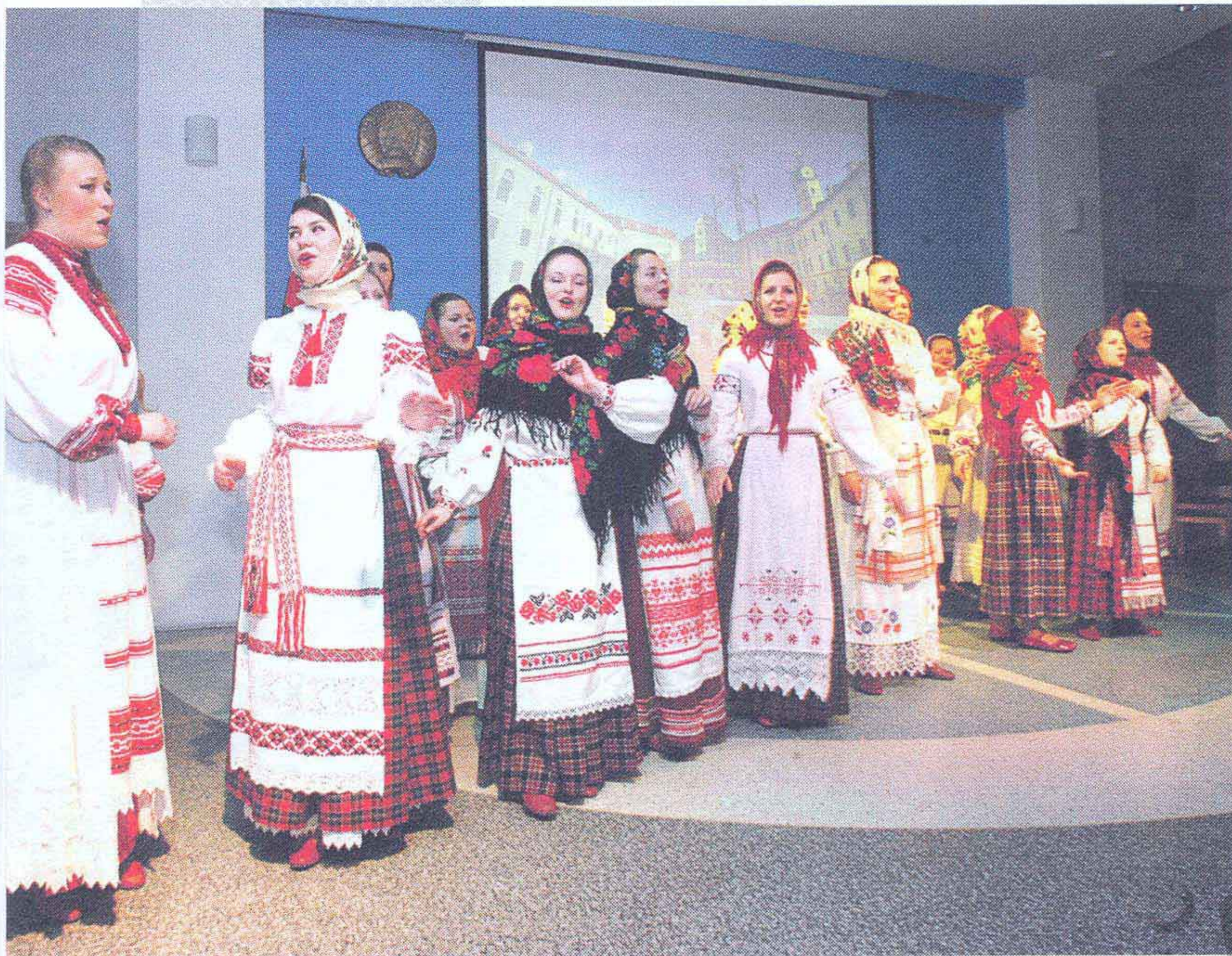
▲► Студэнткі БДУКіМ адзначаюць Дзень роднай мовы. 2012 год

культурных устаноў, распрацоўваць новыя арганізацыйна-кіраўнічыя структуры ў адпаведнасці з патрабаваннем часу і рэальнымі запытамі насельніцтва рэгіёнаў Беларусі.