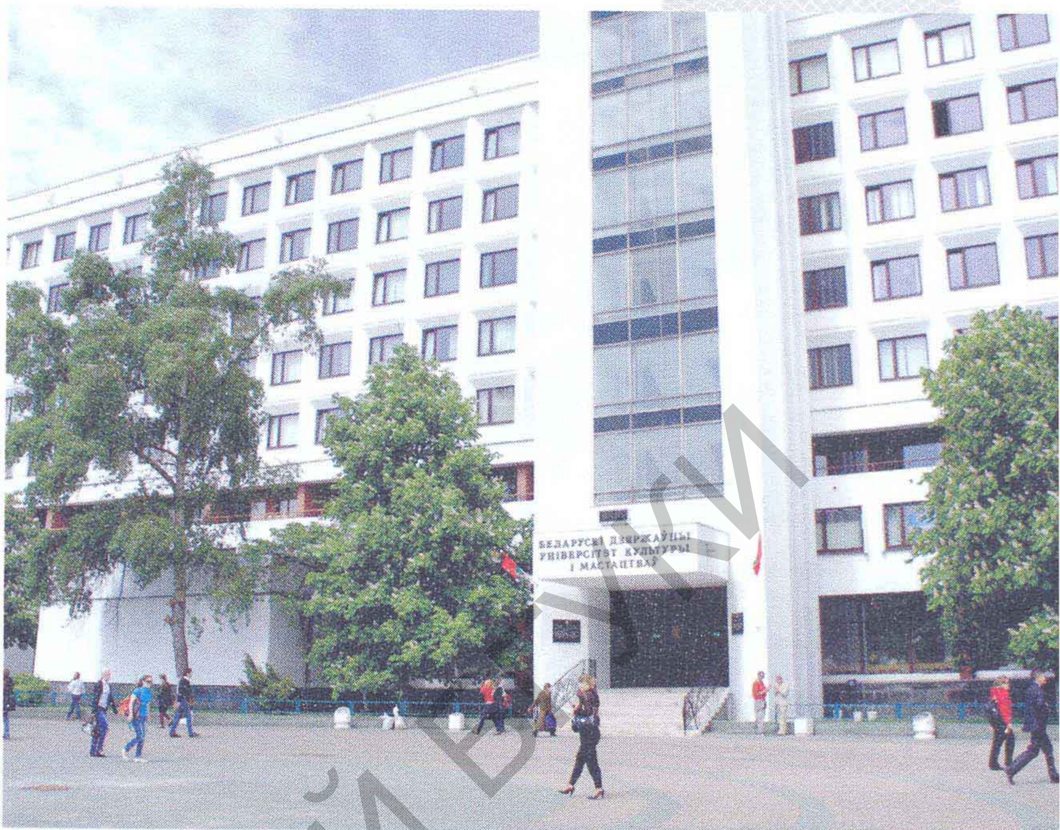
▲ Галоўны корпус БДУКіМ

Стратэгічная мэта і надзённая задача калектыву ўніверсітэта – фарміраванне фундаментальных кампетэнцый спецыяліста: навуковы светапогляд; гуманістычнае духоўна-маральнае развіццё; стымуляванне творчага, інавацыйнага мыслення; кампетэнтнасць у палітыцы і ідэалогіі дзяржавы; устойлівыя навыкі арганізатара ідэйна-