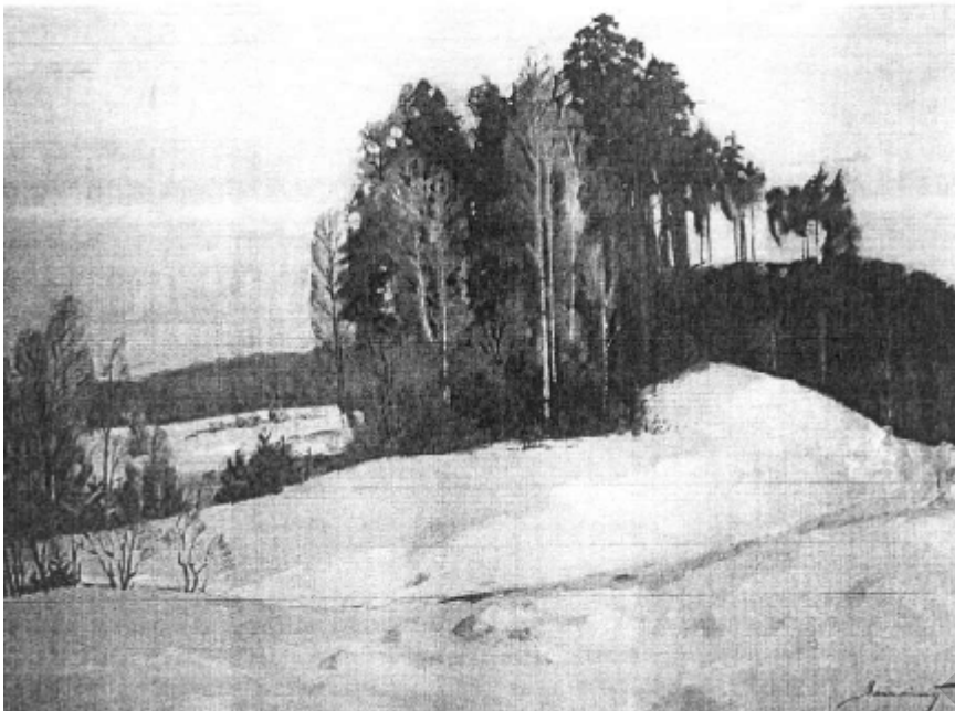
"Сакавік". 2006 г.

— Ёсць музей імя вашага бацькі ў Магілёве. Там шмат яго работ? Музей запатрабаваны? Работы даюць людзям магчымасць даведацца больш пра мастака Паўла Масленікава?