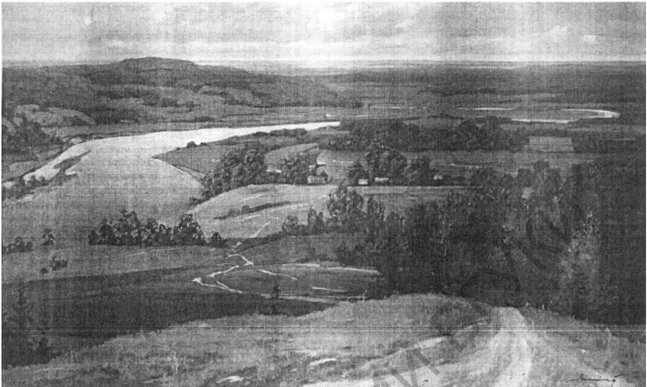
"Беларускія прасторы". 2004 г.

рам. У выніку так і атрымалася, толькі я стаў заўзятым вадзіцелем-аматарам. На машыне еджу з трынаццаці гадоў.