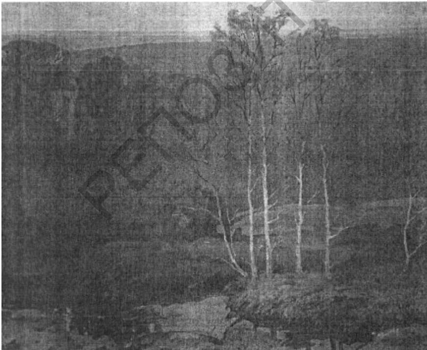
"Ціхі дзень". 2005 г.

— Няўдачы бываюць, вядома. Але яны адносныя. Я магу палічыць нейкую работу няўдалай, а глядач гэтага і не заўважыць. І наадварот. А застоў? Працаваць проста трэба, вось і ўсё. Як гавораць, будзеш чакаць натхнення, можна і не дачакацца. Прышоў, узяў пэндзаль у рукі — натхненне прыйдзе.