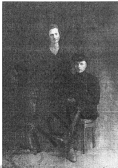
"Апошняя фота мірнага часу". 2005 г.