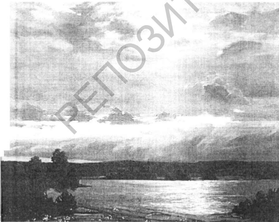
"Азёрны край". 2010 г.