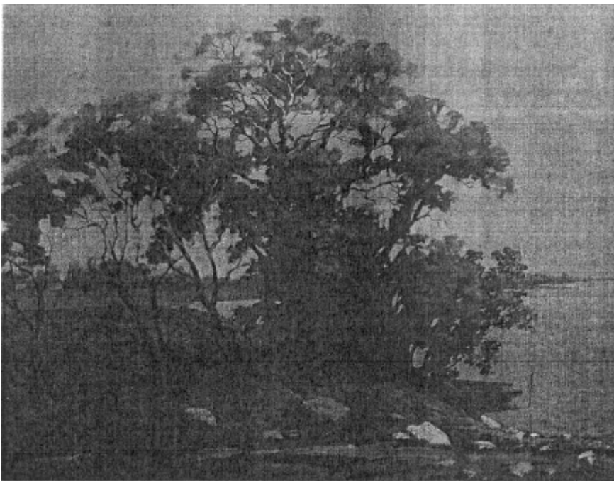
"На беразе возера". 2003 г.

ца ў памяці з ранняга дзяцінства. Такія жывапісныя матывы запатрабаваныя нашымі сучаснікамі, многія з якіх часцяком адарваны ад натуральнага прыроднага асяроддзя, дзе нарадзіліся і выраслі, а жывуць у даволі аднастайным гарадскім асяроддзі. Такую праблему чуйна ўсведамляе гэты жывапісец і спрабуе па магчымасці рассунуць рамкі "бетоннай рэальнасці" і вярнуць дзякуючы творчай здольнасці пачуцці і эмоцыі сваіх шматлікіх прыхільнікаў у зялёнае царства прыроды.