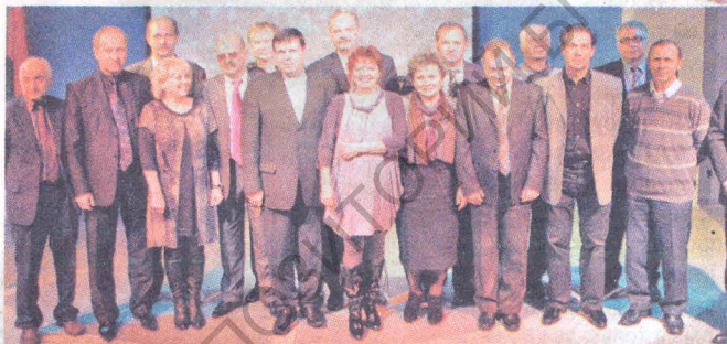
Удзельнікі будатрадаў трыццаць гадоў таму і сёння.