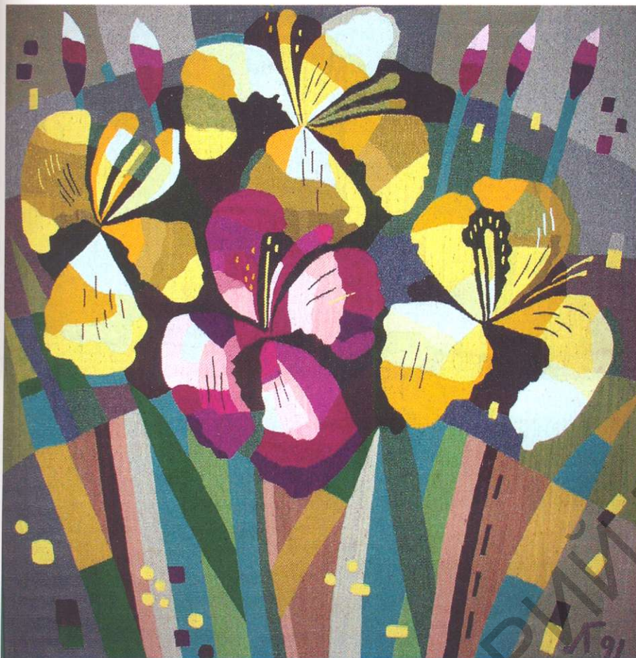
Кветкі. Габелен. 1991.