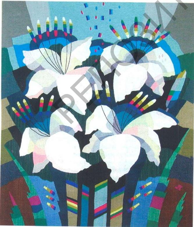
Белыя кветкі. Габелен. 1998.