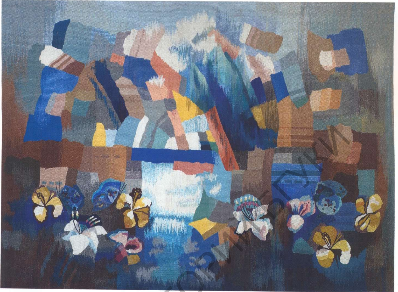
Азёрны край. Габелен. 2007.