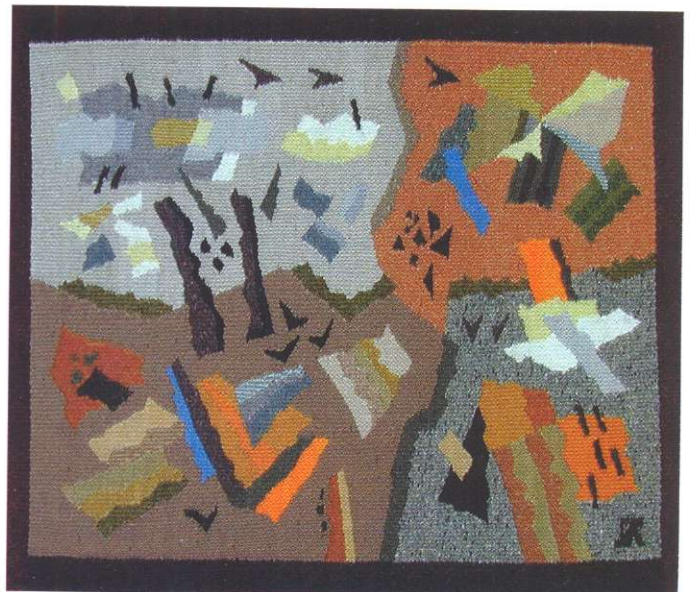
Восень. Габелен. 2008.