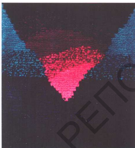
Трывога. Габелен. 1998.

льмі цікава і нечакана па-сучаснаму выглядае выкарыстанне народнай традыцыі ў дыптыху «Світанак» (2004), дзе тонкае каларыстычнае і рытмічнае рашэнне кампазіцыі, збудаванай на аснове простых арнаментальных палос, становіцца таленавітай аўтарскай імправізацыяй на тэму хатняй даматканай дарожкі. Хоць для стылістычнага почырку Ларысы Густавай больш характэрны выразныя контуры і яркія лакальныя колеры, надзвычай удалыя і яе габелены, зробленыя па прыцыпе жывапіснай (дакладней, «тканінапіснай») эскізнасці («Ружовая птушка», 1986, «Гілі», 1987, «Сарокі», 1998). У працах «Раніца» і «Вечар» (2009) каларовыя плямы без рэзкіх межаў вольна перацякаюць адна ў адну, фармуючы рухо-