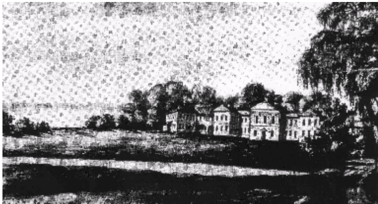
Мал. 1. Палац у Асвеі. 1782 г.

Росвітам будаўніцтва палацаў і сядзіб адзначана сярэдзіна XVIII ст. У гэты час магнацкая рэзідэнцыя фарміруецца ў палацава-паркавы комплекс з вялікім наборам падсобных і гаспадарчых пабудов. Функцыянальна сядзібны комплекс падзяляўся на тры зоны: парадную, паркавую і гаспадарчую. Сядзібны дом з парадным дваром і партэрам перад ім складаюць кампазіцыйнае ядро агульнага архітэктурна-паркавага ансамбля [1, с. 95].