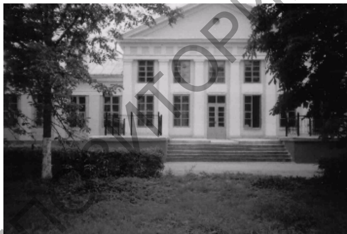
Мал. 4. Палац графаў Тызенгаўзаў

Кожная эпоха (рэнесанс, барока, класіцызм) прыносіла новыя архітэктурныя павевы ў будаўніцтва сядзіб на тэрыторыі Заходняга Паазер'я. Для сядзібных дамоў выкарыстоўваліся розныя тыпы планіровак: ад традыцыйных двух- і трохкамерных да складаных шматпакаёвых з анфіладамі або калідорным размяшчэннем парадных, жылых і гаспадарчых пабудоў.