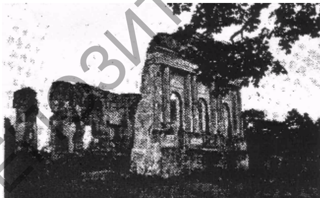
Мал. 2. Асвейскі палац. 1782 г. Руіны.

Паступовае распаўсюджванне арэнднага землекарыстання да канца XVIII – пачатку XIX ст. павялічыла маштабы палацава-сядзібнага будаўніцтва. Яго тыпалогія пашыраецца ад невялікай дробнапамеснай сядзібы (Відзы-Лаўчынскія, канец XVIII – пачатак XIX ст., Браслаўскі р-н – малюнак 3) да манументальнага палацава-паркавага ансамбля з важным горадафарміруючым значэннем (палац Тызенгаўзаў, канец XVIII – пачатак XIX ст., г. Паставы). У ходзе гэтага працэсу да сярэдзіны XIX ст. у асноўным склаўся комплекс палацаў і сядзіб, ацалелая частка якіх у цяперашні час складае высокамастацкую архітэктурную спадчыну Беларусі.